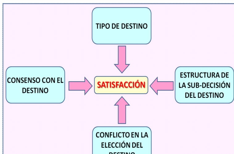
Variables que satisfacción con el