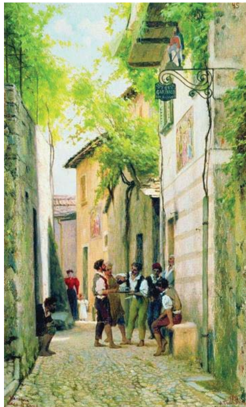
Fyodor Bronnikov Street In Italian Town (s. XIX-XX)

• El poder es uno de sus principales objetivos, tanto de forma directa en su escenario específico de actuación, como de forma indirecta, mediante su infiltración y compra de voluntades de los estamentos oficiales de poder.