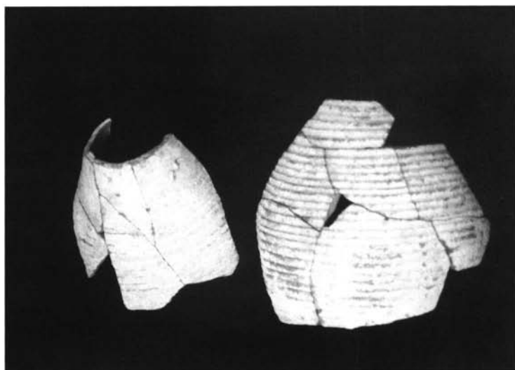
Vasija donde se ocultó el conjunto monetario de Cortijo de Chirino