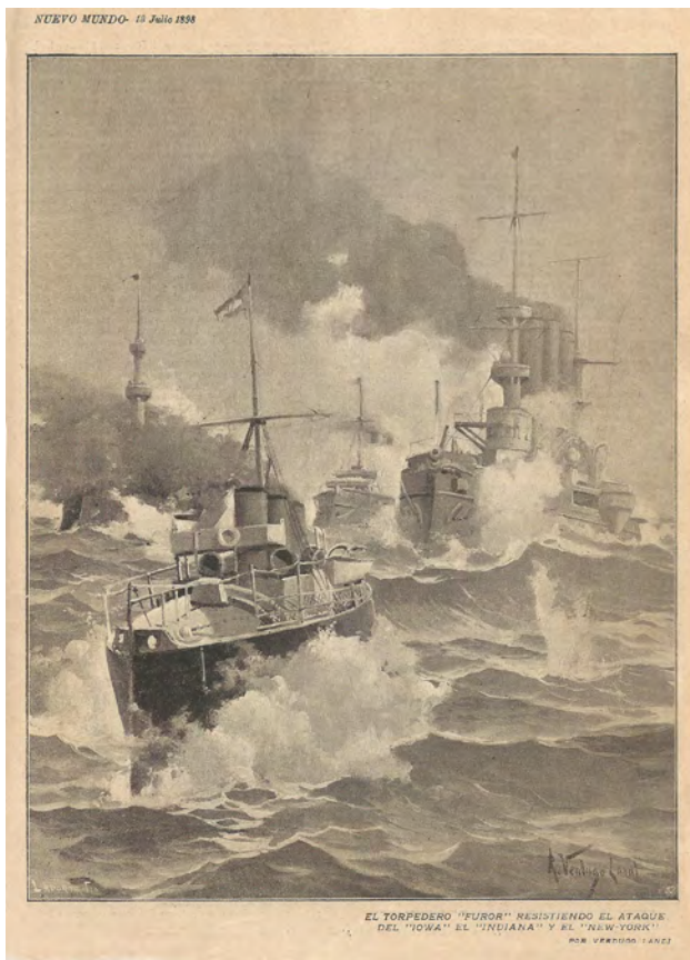
3. Verdugo Landi, Ricardo, Nuevo Mundo , año V, n.º 236, 13/7/1898, s.p. Col. BASL, Málaga

sas ilustraciones, donde los barcos parecen humanizarse y la pequeña nave española atacada por las impresionantes máquinas de guerra enemigas se convierte en la personificación del militar español frente al ejército estadounidense [3]. En comparación con la labor de Ricardo, Francisco publicará en este año pocos dibujos, sin gran importancia ni tamaño en la página, concentradas en la imagen caricaturesca y prototípica del yankí , si bien es cierto que a partir de octubre su trabajo será de mayor calidad y se irá adueñando de la composición de la página, con alguna contraportada a color antes del final del año.