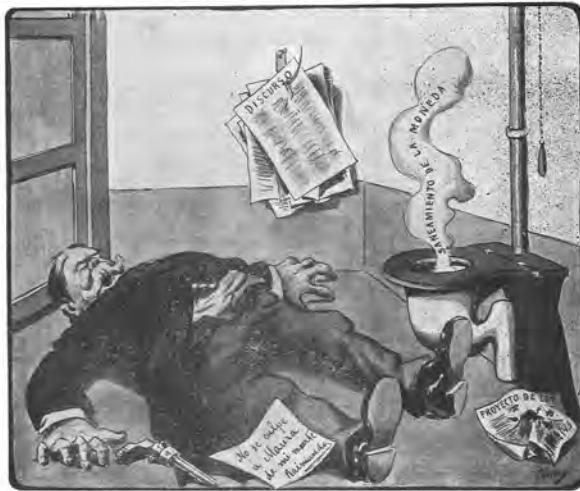
EL SIGUINO DE VILLAVESEDE