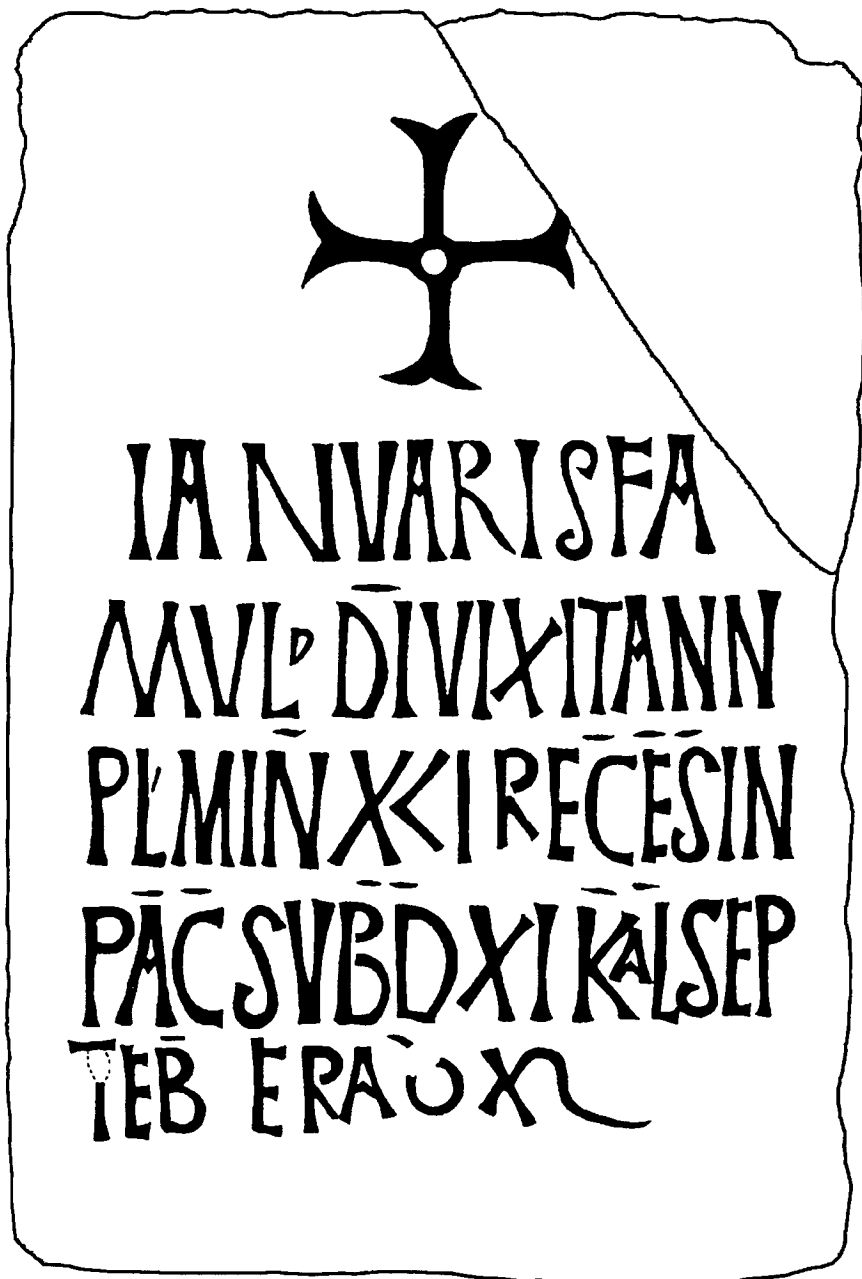
FIG. 3. Texto de la inscripción.