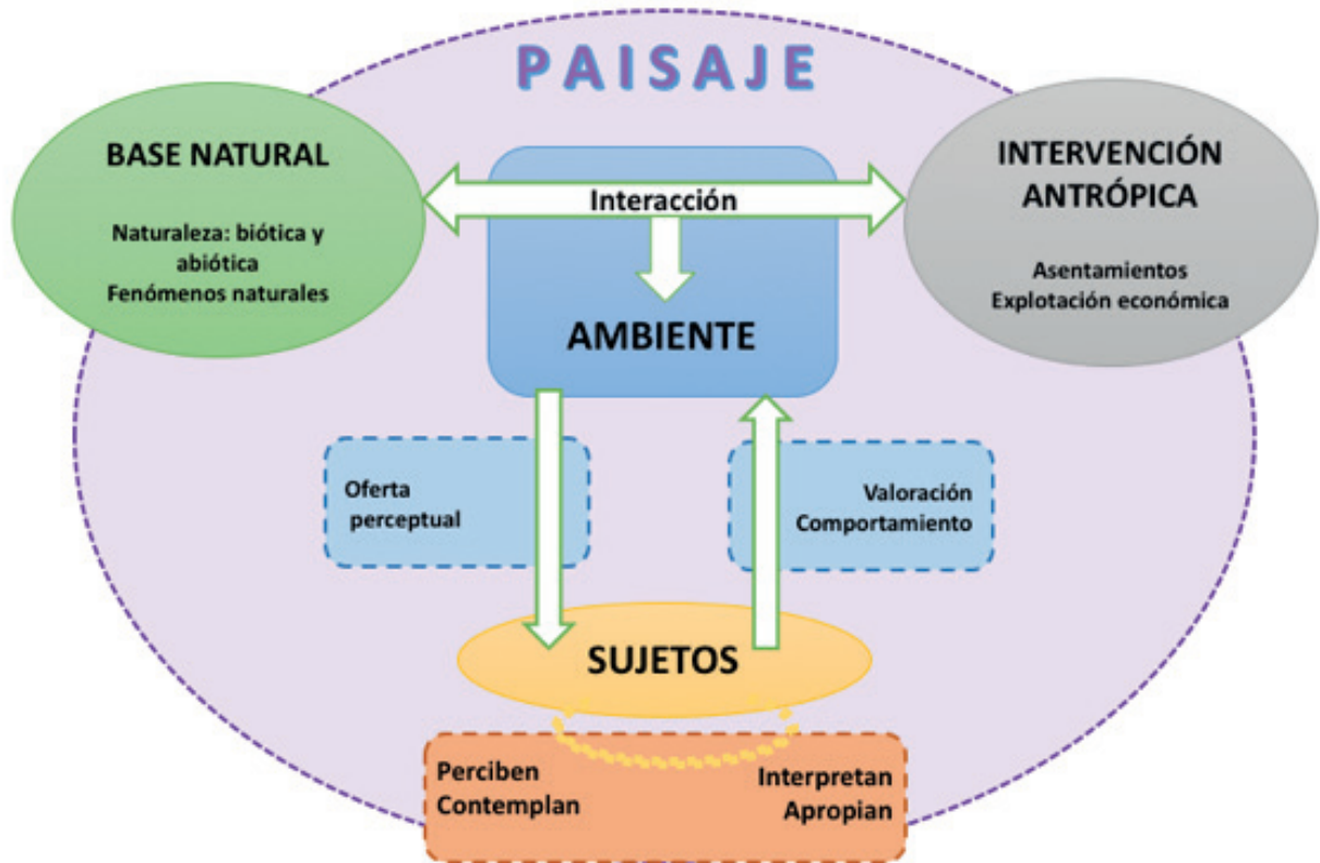
Figura 2. Construcción del paisaje