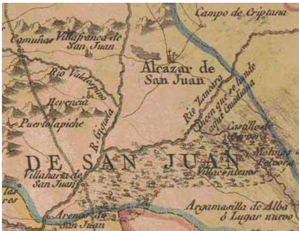
Imagen 2. Situación de la dehesa de Villacentenos según mapa de Tomás López.

1. El término que la villa de Herencia ha de tener en Villacentenos es toda la parte derecha de Villacentenos que hay desde la calzada de Buenavista (“..desde el rio de Guadiana que esta en la calzada de Buenavista..”) por el camino que va desde Herencia a Manzanares hasta llegar a Venta Quesada, incluyendo la parte conocida como Mancha hasta los quinientos pasos que tiene de termino el lugar de Villaharta.