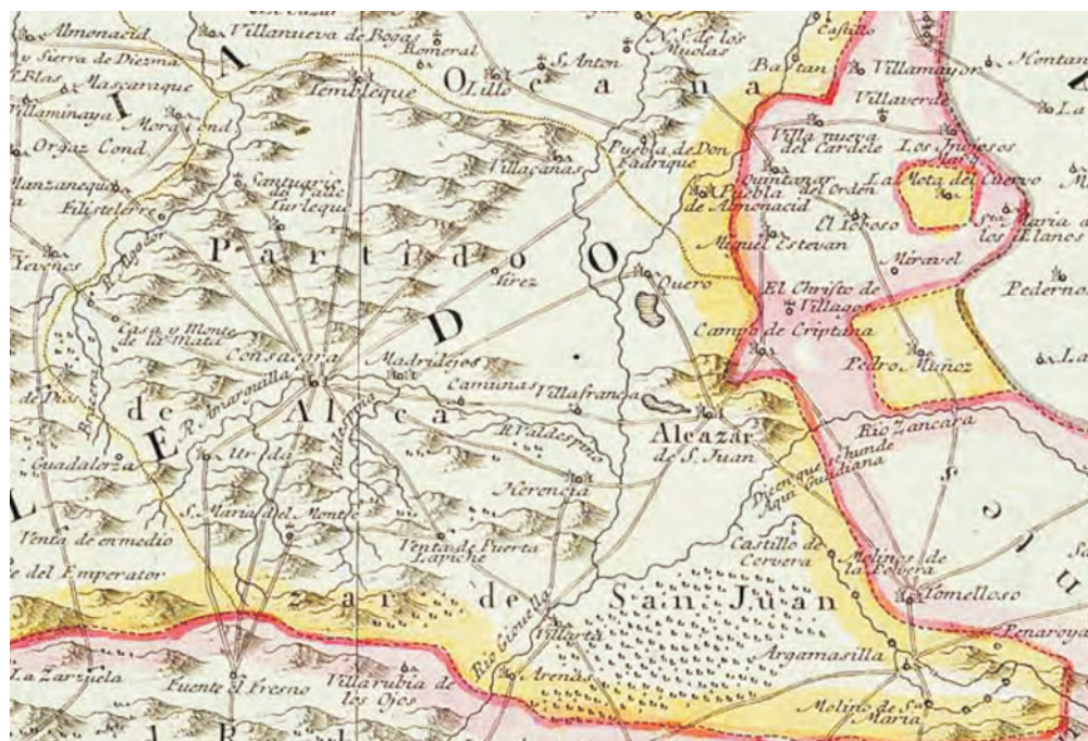
Imagen 1. Situación de la dehesa de Villacentenos según mapas de Tomás López.

estuviese... 17 . El segundo objetivo que buscaba la concordia era evitar nuevos y posteriores pleitos sobre el mismo tema, dependiendo de la opinión de las respectivas justicias y regimientos que rigiesen las villas en otros momentos que no siempre tenían en cuenta acuerdos anteriores. Para ello las villas renuncian a todas las leyes que pudieran, en un futuro, avalarles en nuevas reivindicaciones. Sin embargo los diversos pleitos y acuerdos, incluso esta Concordia, seguirán siendo apelados uno tras otro por la parte perjudicada en la sentencia ya que la razón fundamental de todo ello era que lo que se buscaba por parte de ambas villas era la jurisdicción privativa sobre terrenos cuya propiedad era de la Dignidad Prioral. Apoyando esta idea de titularidad de la Dignidad Prioral vemos como en el siglo XVIII todavía se estará discutiendo la jurisdicción de esta dehesa hasta tal punto de que en el Archivo del Infante Don Gabriel en la sección de Contaduría, aparecen registros de escrituras de reintegración de propiedad de tierras de la dehesa de Villacentenos cuya titularidad es revertida nuevamente a la Dignidad Prioral 18 .