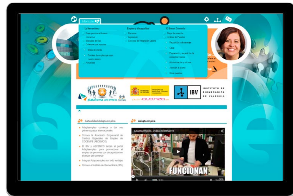
Figura 1 Área de información pública.