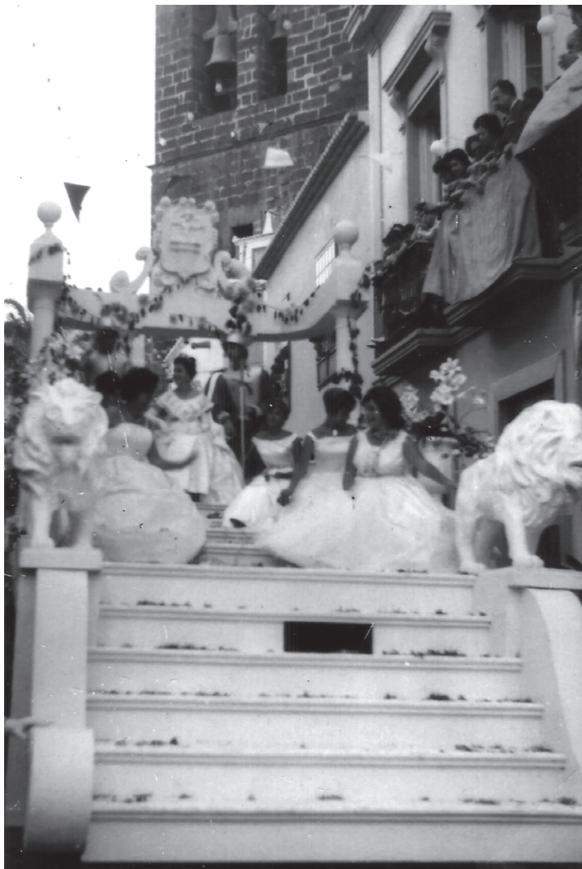
Batalla de Flores II, 1960. Carroza de la Reina de la Bajada de la Virgen a su paso por la calle Pérez de Brito en su cruce con la avenida El Puente.