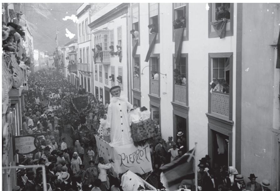
Batalla de Flores VII , 1915. Carroza Pierrot .