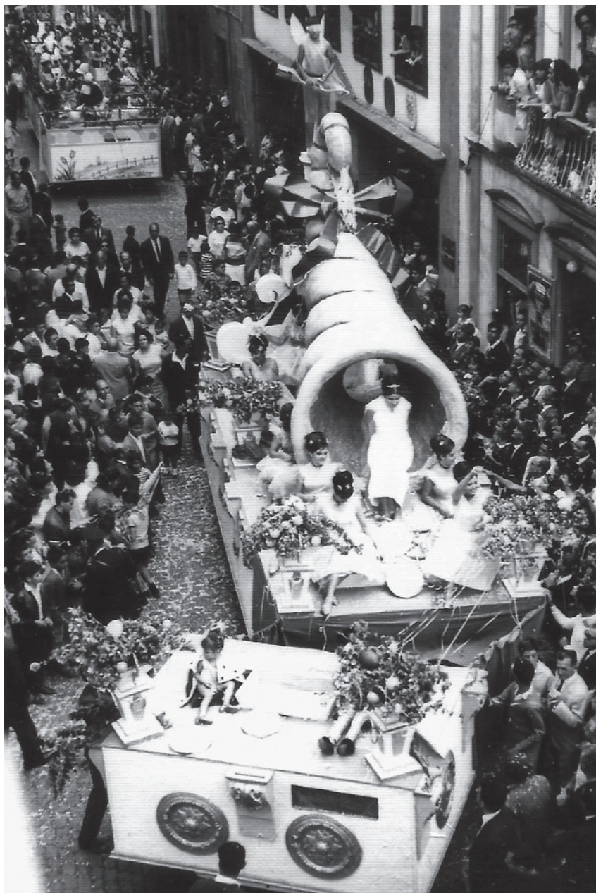
Batalla de Flores IV, ca. 1960. Se trata de una de las carrozas más recordadas en la que se representó una cornucopia o cuerno de la abundancia.