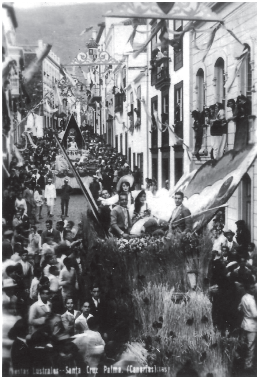
Batalla de Flores VI, 1930. Carroza que representó «una colosal mariposa de amplias alas multicolores posada en un campo de trigo y amapolas».