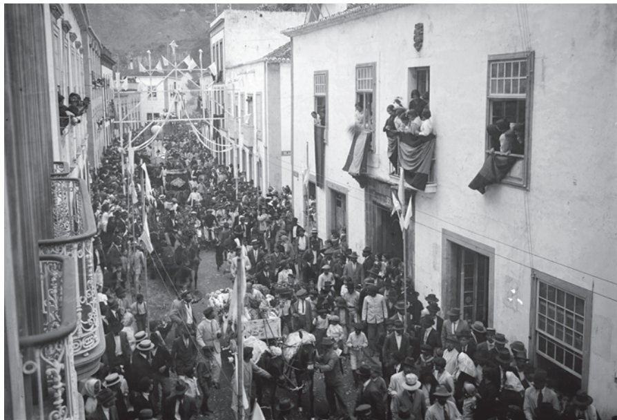
Batalla de Flores II , 1915.