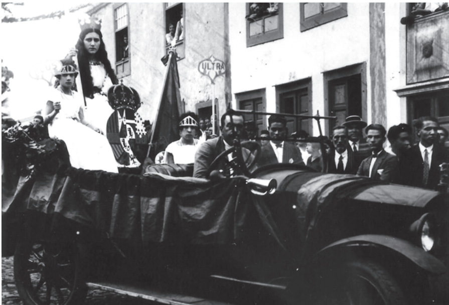
Batalla de Flores V, 1930.