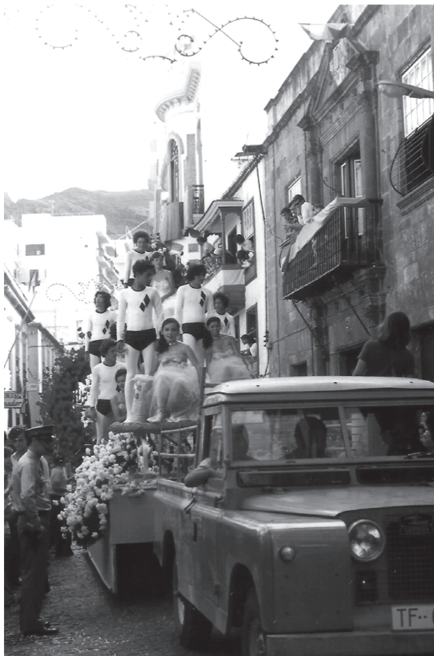
Batalla de Flores II, ca. 1980.