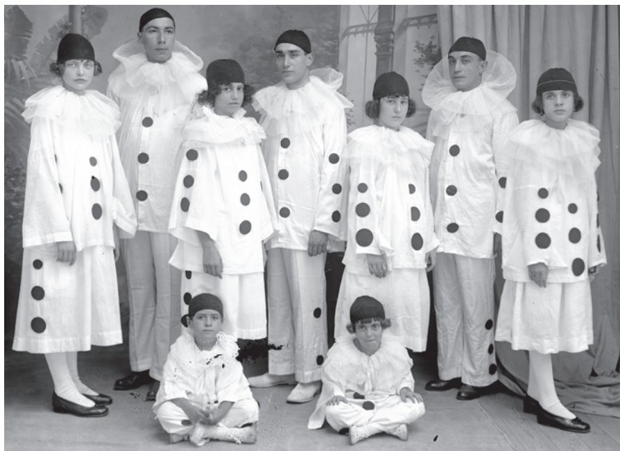
Batalla de Flores VIII, 1915. Grupo de figurantes de la carroza Pierrot.