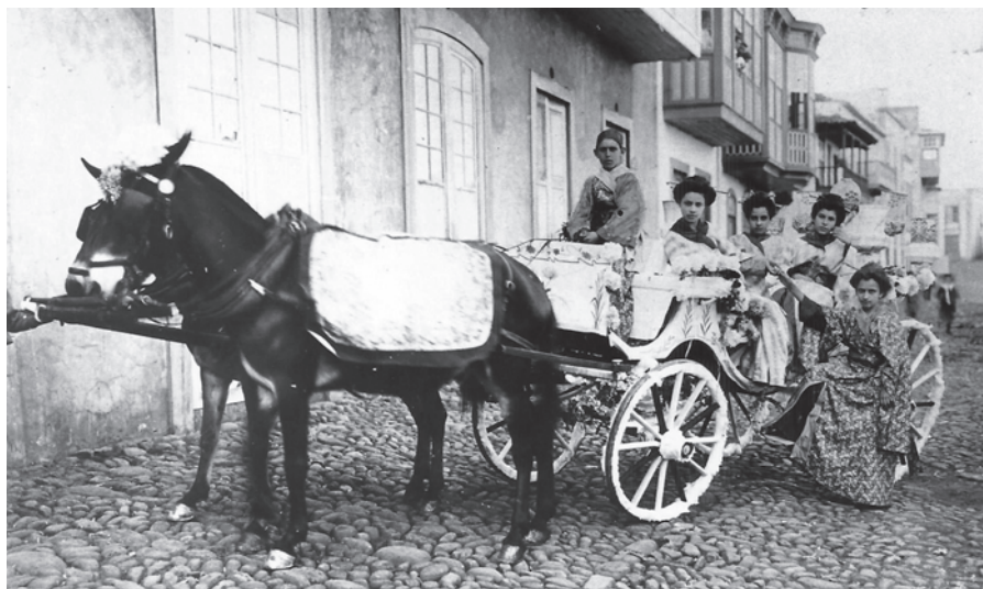
Batalla de Flores XII, ca. 1915.