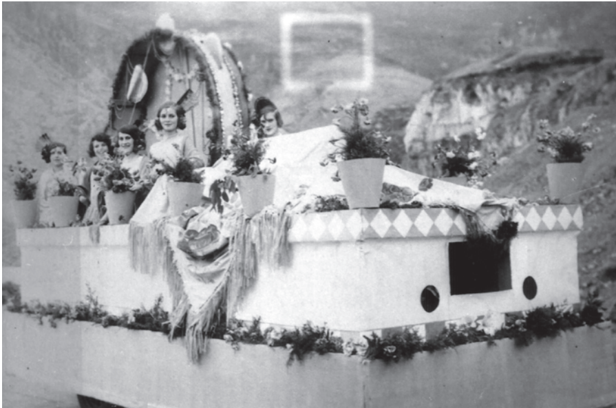
Batalla de Flores IV, 1930. Carroza imitando un patio andaluz.