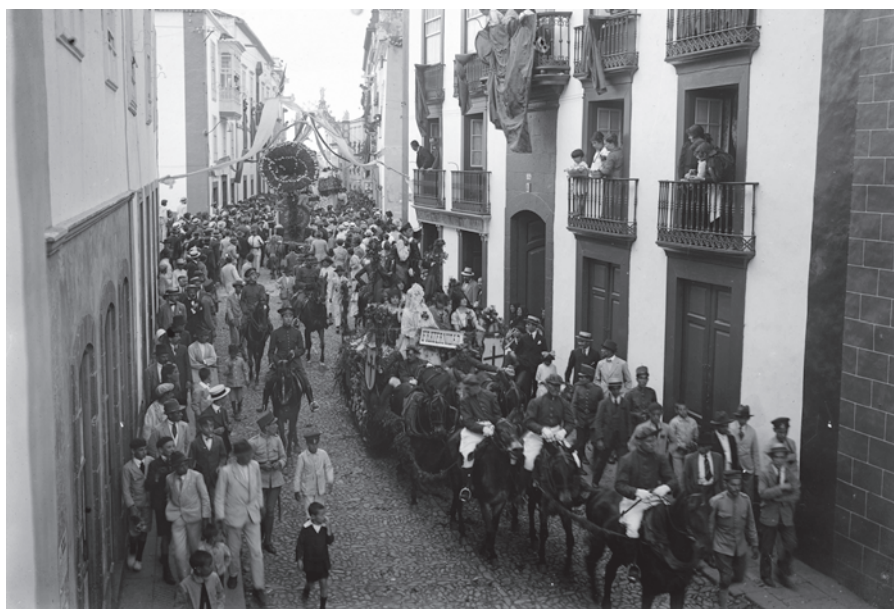
Batalla de Flores V , 1915. Archivo General de La Palma, Fondo Fotógrafos y Dibujantes