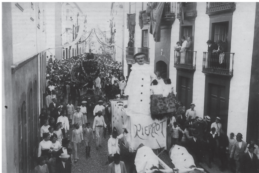
Batalla de Flores VI , 1915. Carroza Pierrot .