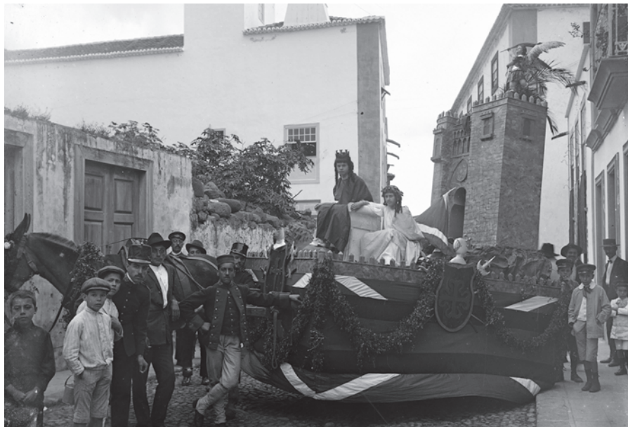
Batalla de Flores X, ca. 1915. Archivo General de La Palma, Fondo Fotógrafos y Dibujantes