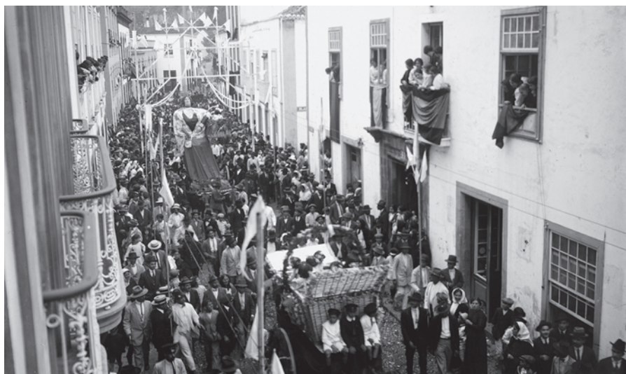
Batalla de Flores 1, 1915.