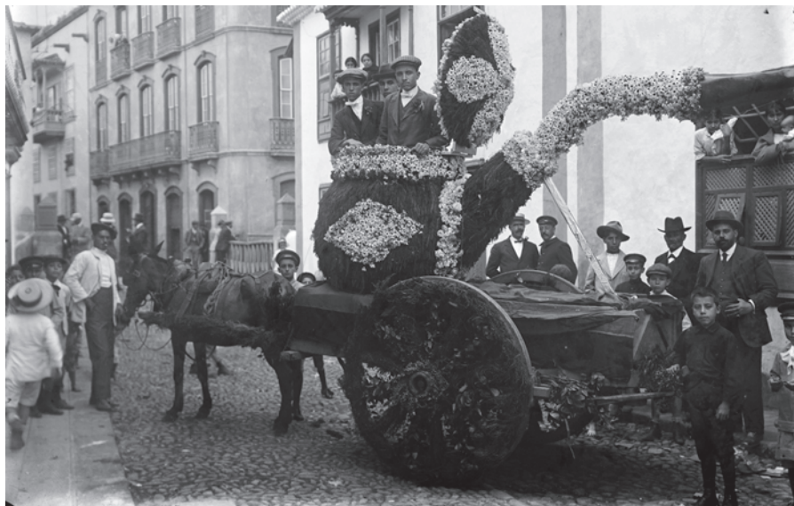
Batalla de Flores IX, ca. 1915.