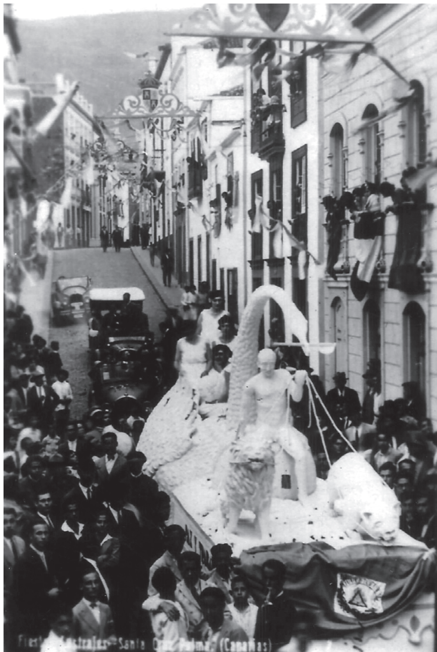
Batalla de Flores VII, 1930. Perspectiva de la carroza Paz y trabajo.