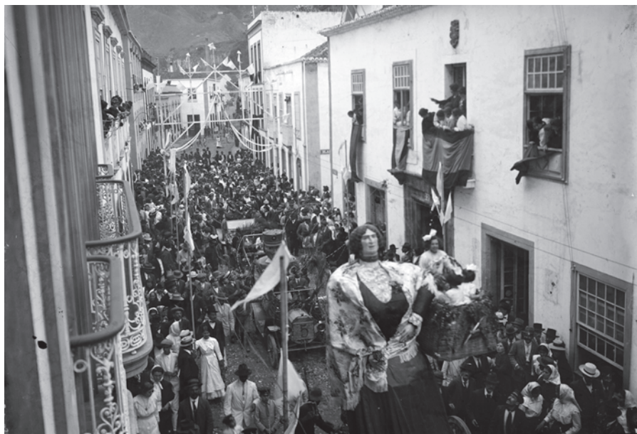
Batalla de Flores IV , 1915.