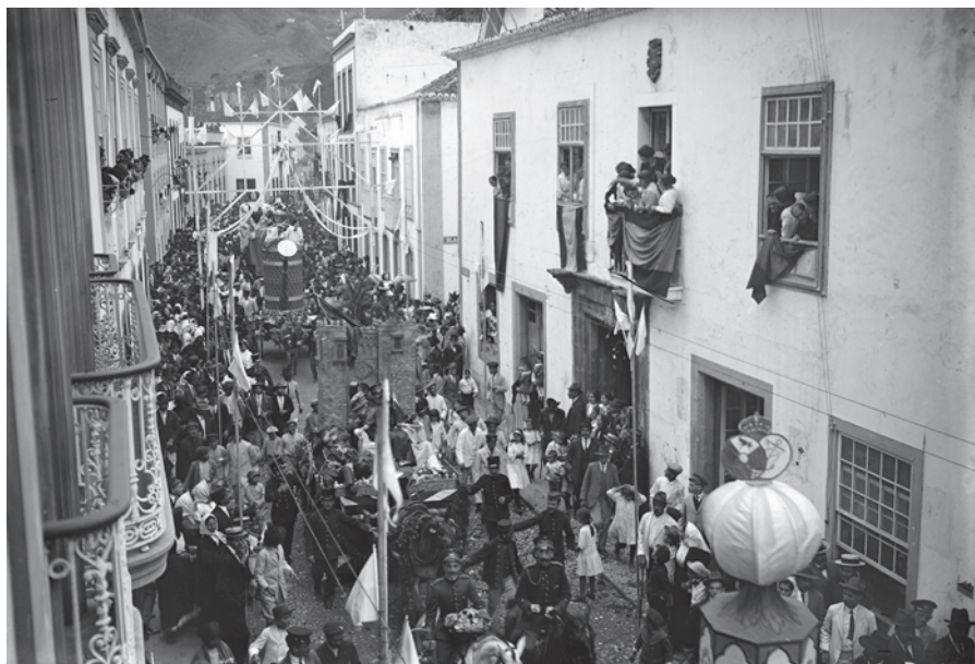
Batalla de Flores III , 1915.