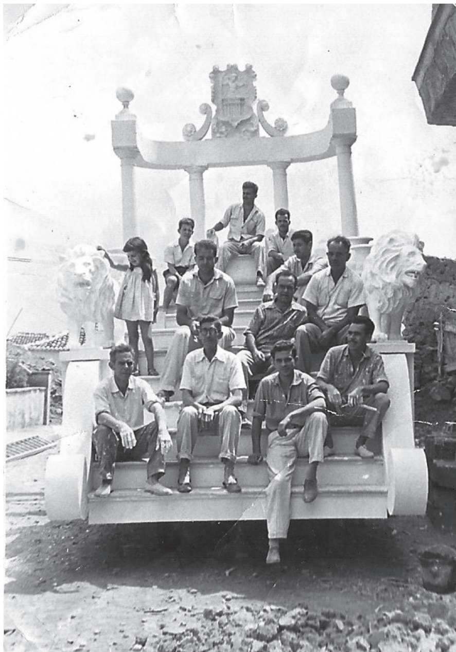
Batalla de Flores 1, 1960. Construcción de la carroza de la Reina de la Bajada de la Virgen. La imagen está tomada frente a la carpintería de la familia Ortega, en la actual calle Navarra.