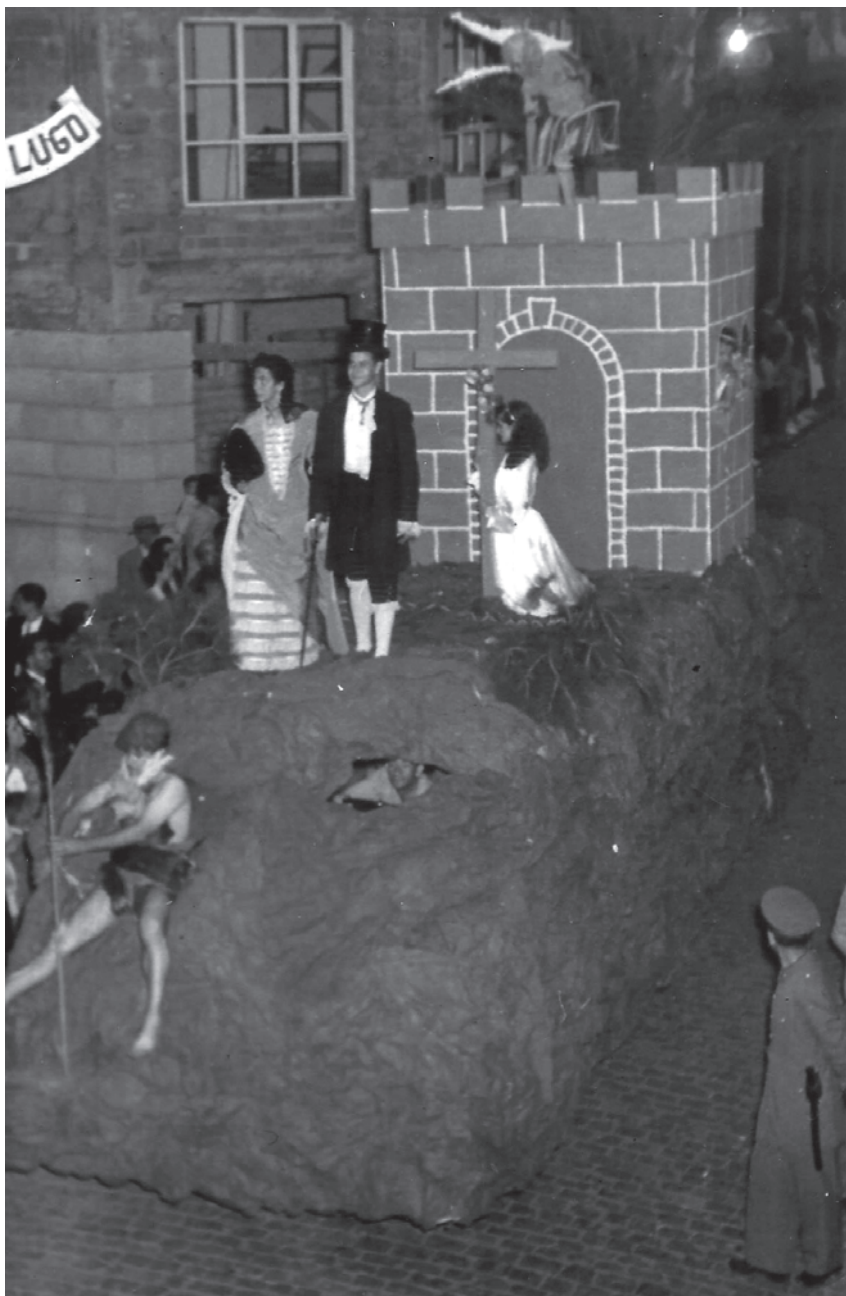
Batalla de Flores III, ca. 1960.