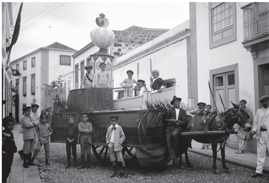
Batalla de Flores XI, ca. 1915.