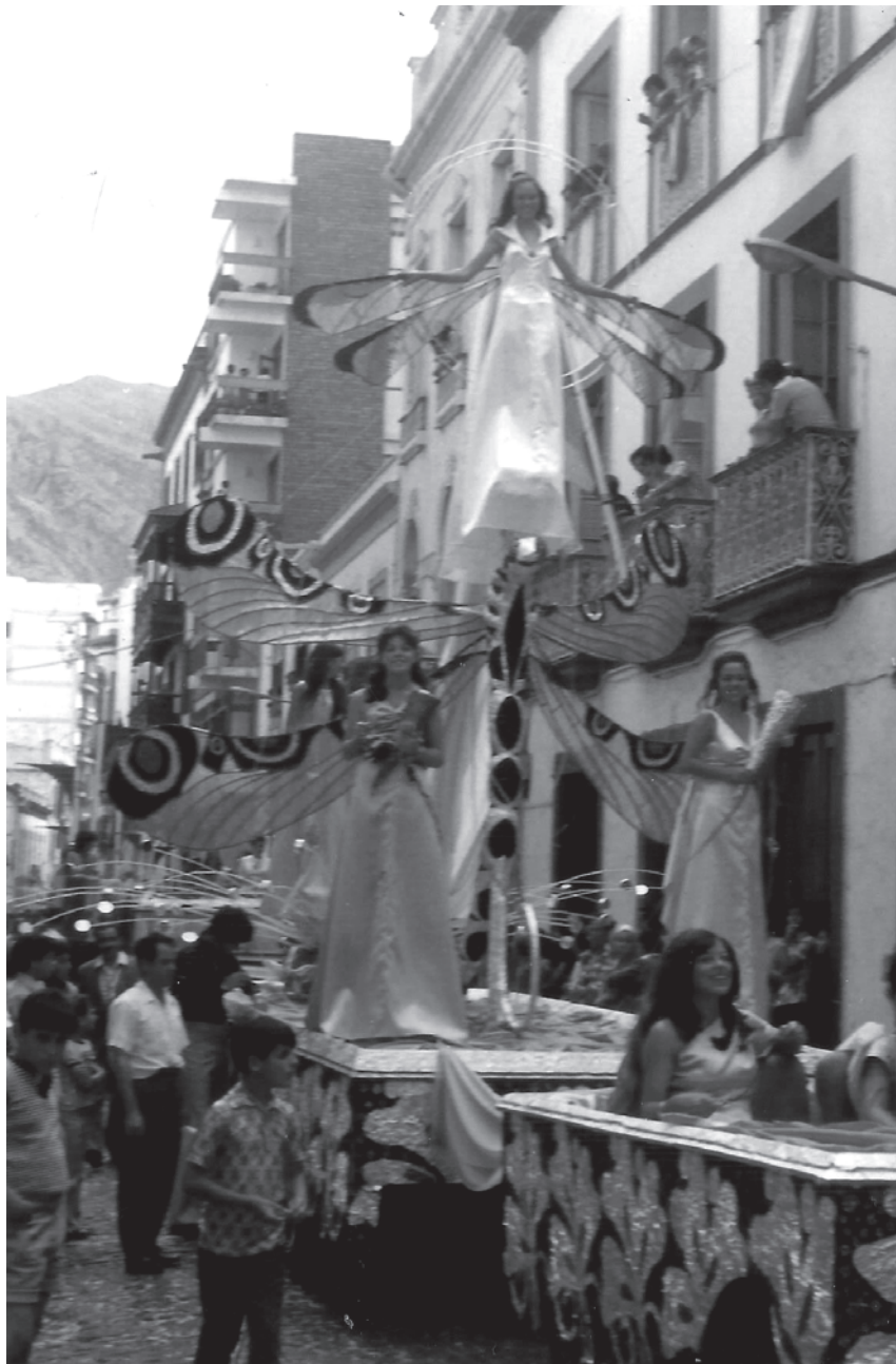
Batalla de Flores 1, ca. 1980.