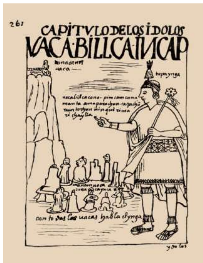
Figura 3. Guamán Poma de Ayala, Tupac Yupanqui habla a las huacas en los cerros , 261 (263), “Capítulo de los Ídolos: uaca-vilca-incap”

Pumapungo es el epicentro de la geografía sagrada de Tomebamba [...] tiene una relación directa con el cerro Guanacuri, ubicado al sur de la ciudad de Cuenca, junto a una cadena de colinas donde fueron ubicadas otras deidades masculinas [...]. De Pumapungo partían los ceques (líneas imaginarias) hacia las huacas epicentrales circundantes, cerros guirnalda sagrada de los Incas, [...] puesto que algunos constan como sitios adorados con simbolismos religiosos 22 .