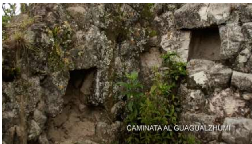
Figura 4. Equipo de investigación, arqueología de el Guagualzhumi . (2016).

Es pertinente pensar en incluir, en la formación general de los futuros arquitectos, nociones de Patrimonio, no sólo material sino inmaterial. Disciplinas como la antropología y arqueología, incluidas en las mallas curriculares de la oferta académica, refuerzan la mirada crítica de los futuros profesionales sobre las prácticas culturales atentatorias, así como su sensibilidad objetiva para detectar, recuperar y poner en valor los testigos materiales de nuestras culturas ancestrales, ocultos bajo capas de desarrollo (Figura 4).