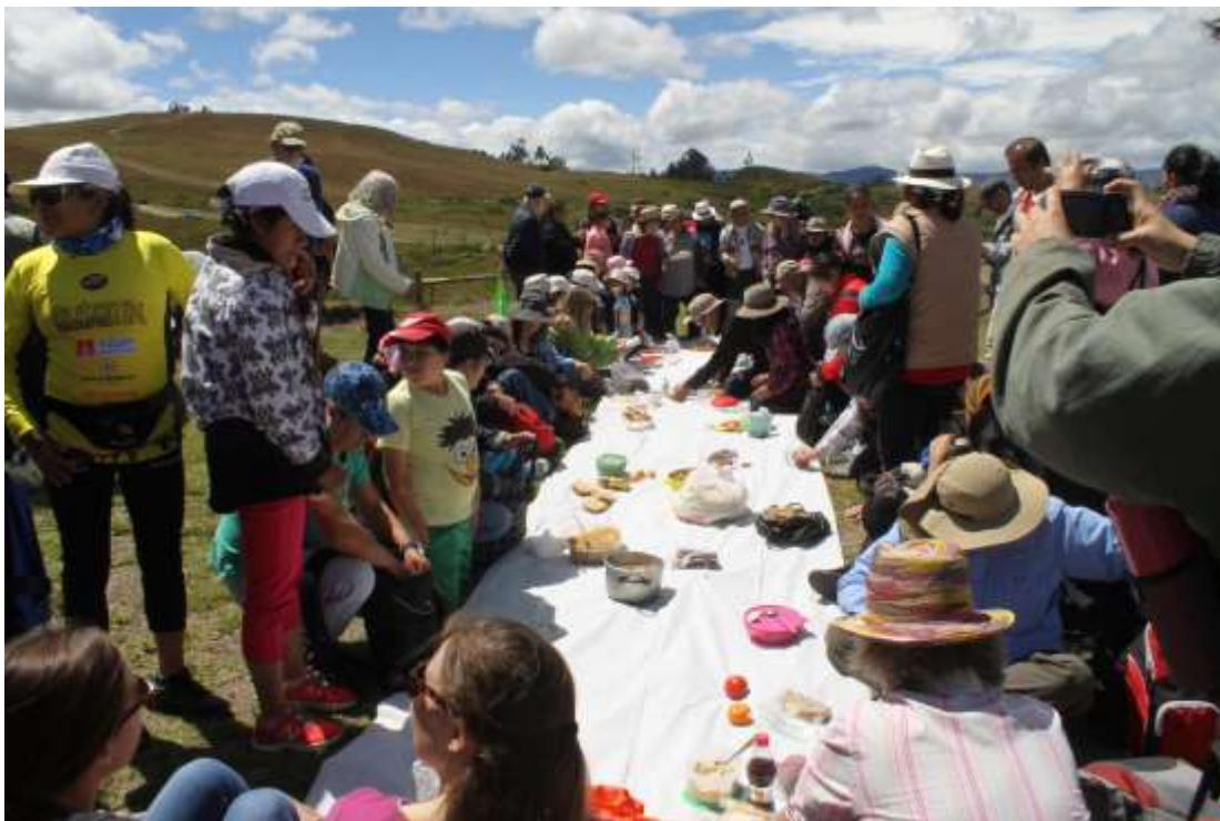
Figura 1. Equipo investigador, Pampamesa . (2015).

Como atestiguan los habitantes cercanos a los cerros Ictocruz, Pachamama o Paredones; los pobladores suelen utilizar las piedras de los muros arqueológicos para hacer cimientos de casas, corrales y otros usos. Al llevarse estos testigos, que no son capaces de expresarse por sí solos, sino en el conjunto que les otorga unicidad y sentido constructivo, dejan de ser vistos y se extinguen con su voz mnémica: “ cortamos y aplanamos cerros sagrados para construir, devastamos bosques para sembrar monocultivos o pastizales, eliminamos chacras y tierras negras para construir urbanizaciones, tapamos acequias en nombre del progreso, para vivir mejor ” 3 . Estas son las reflexiones que durante una de las muchas pampamesas 4 en los cerros, se escuchan mientras se abrían los quipis 5 y se esparcía la comida, en un gran mantel extendido en la tierra (Figura 1).