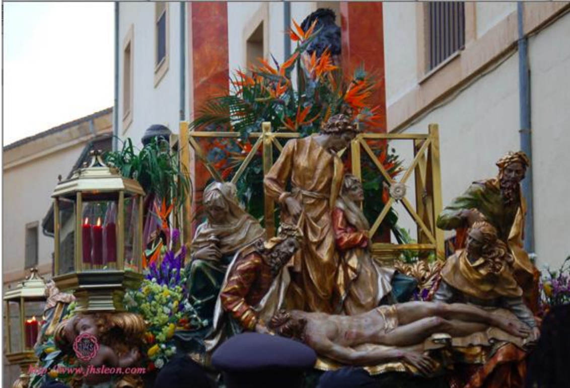
Fig. 6: Trono del paso Ecce-Homo , Melchor Gutiérrez Sanmartín, 1998. Cofradía del Dulce nombre de Jesús nazareno, León.

escultórica en el mismo material. Siendo ambos dos autores de alto nivel, aunque diferente propuesta estética, se sigue poniendo en valor el trabajo manual por encima de los apoyos técnicos que hoy en día están a disposición.