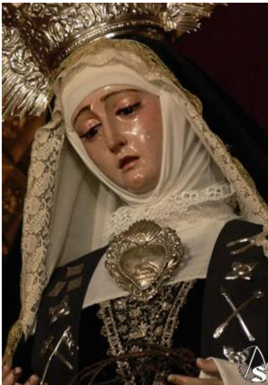
Fig. 7: Virgen del rosario en sus misterios dolorosos. Atribuida al círculo de Roldán. 1586-1613. Capilla de Montesión, Sevilla.

de luto, indumentaria de las dolorosas castellanas 4 . Este estudio recoge la evolución del traje de luto castellano y la aplicación de este a las dolorosas de vestir. Tal ha sido la importancia de esta investigación que en la actualidad nos encontramos con numerosas obras vestidas siguiendo los criterios, ya no solamente estéticos, sino simbólicos y tradicionales en muchos casos. (Fig. 7)