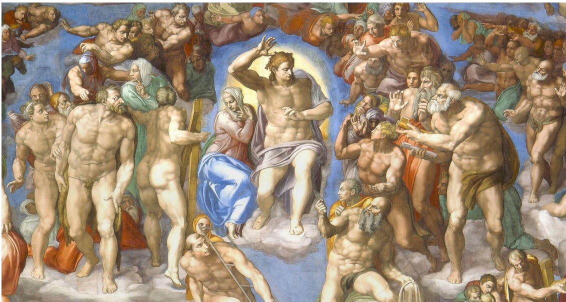
Fig 1: El juicio final, Michelangelo Buonarroti 1533-1541. Capilla sixtina, Basílica de San Pedro del Vaticano, Roma.

Este tipo de representaciones fue evolucionando de una forma paralela a los desarrollos artísticos en cada periodo histórico adaptándose a los nuevos cánones o las tendencias representativas de cada tiempo o lugar, formando parte de la evolución de la historia del arte. El buen ejemplo que ilustra esta evolución sería la representación del icono del Pantocrátor , como Cristo todopoderoso en su trono celestial, y la interpretación que hace Michelangelo en la capilla Sixtina de este mismo icono en el juicio final. (Fig. 1)