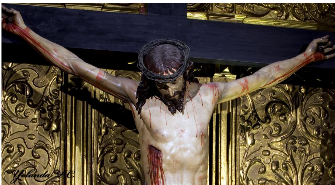
Fig. 3: Cristo de los Valderas , Gregorio Fernández 1634, Iglesia de San Marcelo, León.

proporciona unos recursos artísticos al escultor que lo sitúan a un nivel superior en cuanto a recursos científicos objetivos, debido entre otras cosas a los avances en estas investigaciones, a los artistas del renacimiento y barroco. Si bien somos conscientes del nivel de estudio anatómico que alcanzaron algunos artistas como Leonardo Da Vinci o Michelangelo, y la representación de algunos aspectos tanatológicos que ya en su momento Gregorio Fernández utilizó en la representación de Cristo muerto, gozando en la actualidad de un gran rigor forense en la representación y conocimiento de esta. En el libro Signos de la muerte en los crucificados de Sevilla 2 . Encontramos un estudio sobre esos aspectos forenses que de alguna forma han fueron representados en la iconografía del crucificado desde el punto de vista médico y siguiendo en todo momento unos patrones de medicina legal tales como el rigor mortis , la facies hipocrática , las livideces cadavéricas entre otros demostrando que en épocas pasadas existía una intención por parte de los escultores de representar esa verdad partiendo, no tanto de un estudio científico, sino de la observación. (Fig. 3)