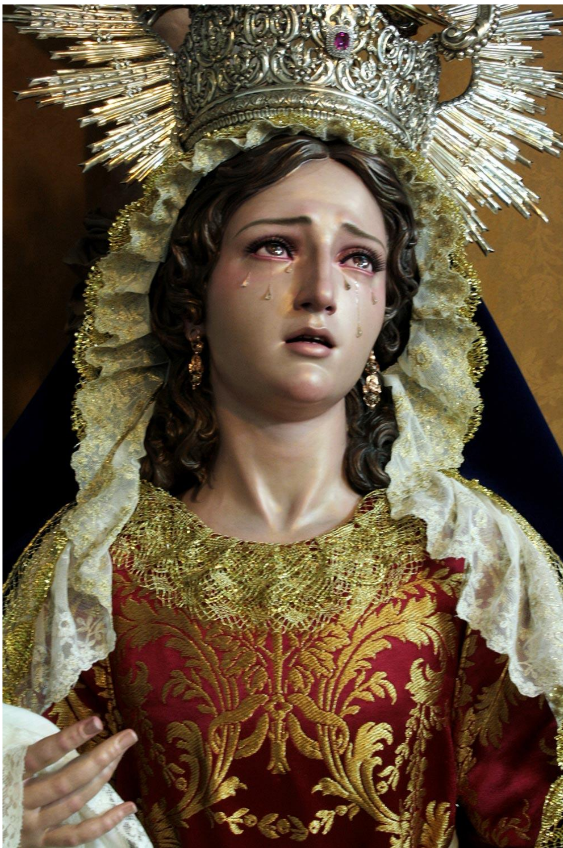
Fig. 4: Dolorosa afligidos , Francisco Romero Zafra, 2015. Icod de los vinos, Tenerife. Foto: Francisco Romero Zafra.