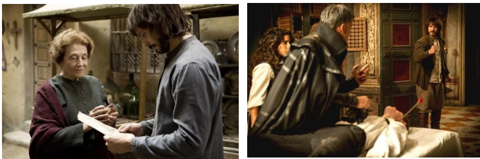
Figura 3. Relaciones secretas entre los personajes. Fotogramas de los capítulos 5x07 y 6x01 de Águila Roja.

-Nuño no sabe que su verdadero padre es Hernán y que su tía es por tanto Irene, con la que se acuesta y de la cual está enamorado.