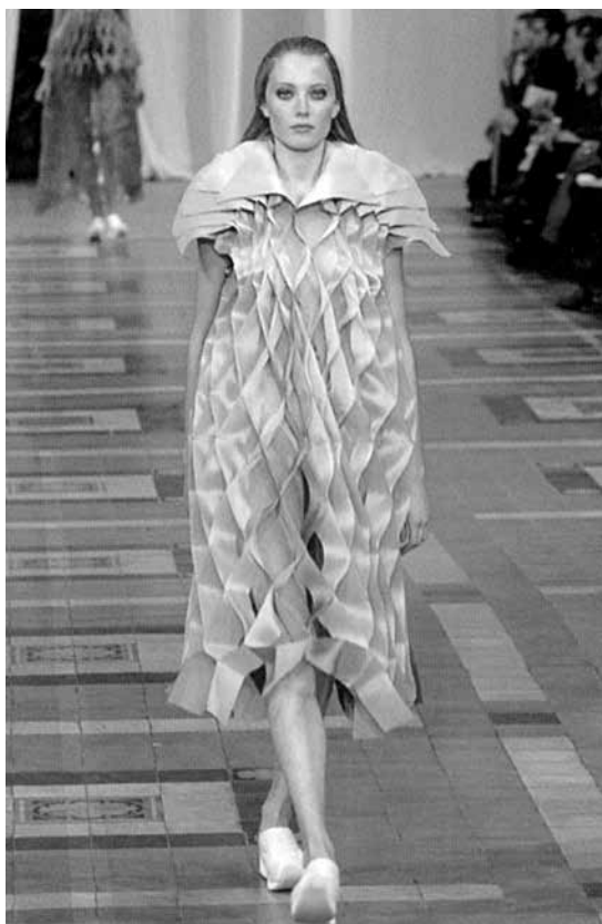
Figura 2: Princípios de dobradura na construção de Yoshiki Hishinuma