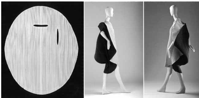
Figura 7: Geometria texturizada transformadora Fonte: Spilker; Takeda (2007, p. 132-133)

No projeto A-POC – termo cunhado de A Piece of Cloth – desenvolvido em parceria com o engenheiro têxtil Dai Fujiwara, os produtos não são montados por meio de um processo de costura, mas se originam de um esquema, fruto da programação computadorizada para obter uma malha estrutural construída a partir do fio selecionado (Figura 8).