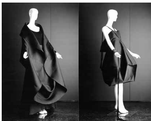
Figura 3: Princípios de Suspensão na construção de Yeohlee Teng

Conduzidos pelo mesmo pensamento estrutural, designers de moda utilizam princípios arquitetônicos para manipular a estrutura e o volume das vestimentas: Ralph Rucci, Junya Watanabe, Teng (Figura 3) e Isabel Toledo, cada um a seu modo, aplicam princípios de suspensão para estruturar seus produtos.