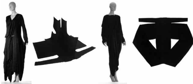
Figura 6: Complexidade na geometria construtiva de Rei Kawakubo

No design de moda, Rei Kawakubo explora as formas geométricas na construção dos moldes. No entanto, quando estes produtos estão vestidos, muitas vezes a geometria que os gerou torna-se invisível, devido à ocupação do espaço da forma pelo corpo e ao caimento do tecido mediante a ação da gravidade. Isto pode ser observado na série de imagens gráficas das coleções de Rei Kawakubo para Comme des Garçons , realizadas por Naoya Hatakeyama, a pedido do Kyoto Costume Institute , em 2008 (FUKAI et al, 2010). A partir das fotografias que registram os produtos sobre uma base plana, não é possível distinguir onde se posicionam os acessos que viabilizam o vestir e o desvestir, tampouco discernir qual seria a sua configuração quando vestido no corpo, tal a diversidade formal e a não similaridade com silhuetas já conhecidas e previstas (Figura 6).