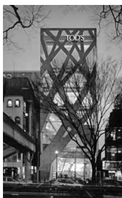
Figura 4: Pele estrutural de Toyo Ito

No contexto dos princípios estruturais situam-se também os edifícios-pele , aqueles nos quais uma superfície externa contínua recobre o quadro estrutural, aspecto que pode ser identificado em algumas obras de Toyo Ito (Figura 4). No que se refere à moda, a pele estrutural em seda pura de Cláudio Pádua Rodrigues, produto da coleção Habita-te , está ilustrada na Figura 5. Na fase inicial, o mourim é empregado na etapa de experimentação, onde a casa-de-abelha é a técnica aplicada como recurso de construção e que se mantém voltada para o interior do produto com o intuito de gerar na parte externa o efeito tridimensional observado.