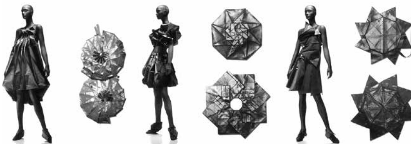
Figura 9: Geometria dobrável

Em projeto mais recente – a coleção “132 5” –, Issey Miyake propõe uma nova maneira de construir: baseado em formas geométricas, transforma a criação tridimensional (3D) em bidimensional (2D). As peças originam-se a partir das dobraduras, viabilizadas por meio de termocolantes, sem costuras e cortes. É visível a sensação de movimento circular provocada pelas estruturas. O planejamento das dobras viabiliza uma estética relevante para expor e embalar os produtos. Quando vestidos no corpo (3D), o desdobraimento gera inovador resultado formal (Figura 9).