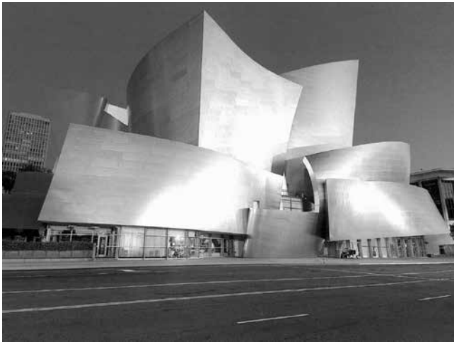
Figura 10: Geometria flexível e articulável Fonte: Hodge (2007, p.110)

As formas esculturais configuradas pelas dobras e plissados a partir da geometria influenciaram uma diversidade de projetos arquitetônicos, entre os quais o Max Reinhardt Haus , de Eisenman Architects, e o Walt Disney Concert Hall , de Frank O' Gehry – este último um esqueleto de aço no qual vários painéis criam expressivas curvas que lembram as velas dos barcos (Figura 10). No seu interior, observa-se o grande órgão cuja estrutura geométrica flexível e articulada foi cuidadosamente projetada para garantir, além do relevante resultado estético, a qualidade musical.