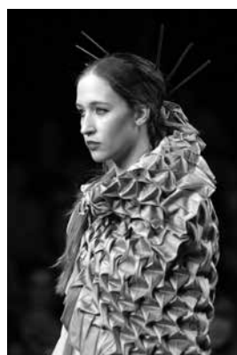
Figura 5: Pele estrutural de Cláudio P. Rodrigues