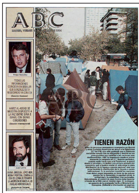
Figura 1. Portada periódico ABC (28/10/1994).

El diario abre su edición con el titular “Tienen razón”. Una clara y contundente declaración de apoyo a las reivindicaciones. Actitudes que luego no mantuvo cuando el Partido Popular (PP), bajo la presidencia de José María Aznar, estaba en el Gobierno y las ONGD reclamaron la aprobación de la Ley Española de Cooperación al Desarrollo entre marzo y junio de 1998 o el ‘No a la Guerra’ de Irak en el año 2003.