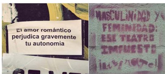
Figura 3: Acciones directas en Sevilla Ilustración 1 Visibilización mediante pegatinas (izquierda) y estencil (derecha)

A continuación veremos algunos de los lemas utilizados en estas acciones, para ello nos fijaremos en algunos de los grafitis textuales y estencil llevadas a cabo en la ciudad Sevilla. Hemos elegido estos mensajes por ser ejemplos gráficos de las formas de participación que venimos comentando y que tienen una relación directa con diversas reivindicaciones en torno a la igualdad.