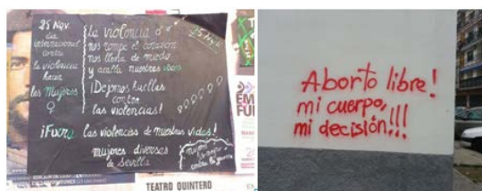
Ilustración 2 Visibilización mediante cartel (izquierda) y grafiti textual (derecha)

Estas fotografías representan sólo algunas de las temáticas y técnicas utilizadas para reivindicar derechos de las mujeres. En el caso de la primera imagen se alerta sobre los efectos del amor romántico en cuanto a la propia independencia personal, en la segunda se mencionan aspectos relativos a las imposiciones socioculturales en cuanto a sexo y género.