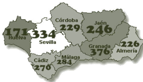
Figura 2: Las asociaciones femeninas sobre el territorio en Andalucía

La ubicación sobre el territorio de estas asociaciones es desigual, en ocasiones motivada por el número de población pero sin duda también por el grado de incentivación que se haya realizado en los territorios, originando la representación que a continuación mostramos: