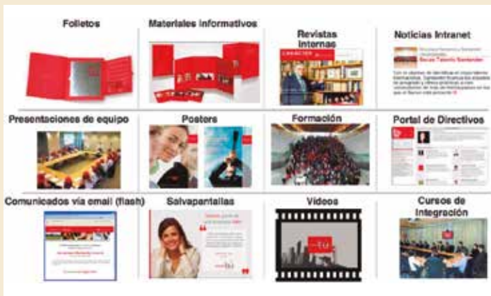
Figura 1. Herramientas de comunicación interna de la campaña

Partimos del hecho de que la campaña de comunicación interna que se llevó a cabo dentro del proceso de employer branding obtuvo un porcentaje de conocimiento muy elevado, el 89,3% de