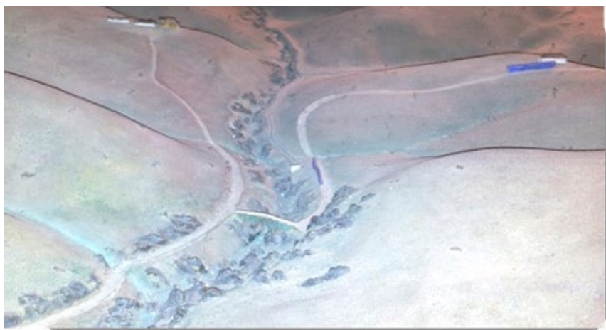
El Santuario de Zocueca y la aldea de El Rumblar (a la izquierda), El Ventorrillo (a la derecha), el Camino Real y el río en 1808 (Maqueta del Ejército, Museo-Centro de Interpretación de la Batalla de Bailén de 1808).

Es muy probable que hubiera un templo aún anterior a ese siglo XII. Sobre la antigüedad del primitivo santuario, Rus de la Puerta añade: