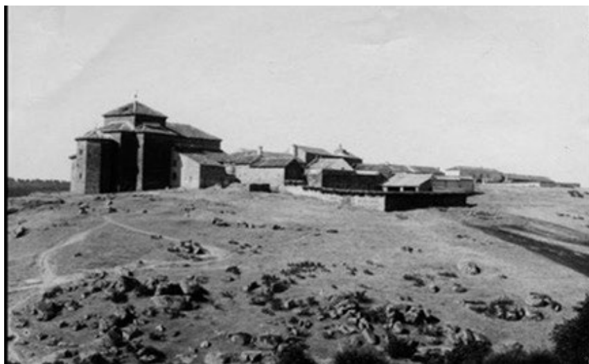
Santuario de Nuestra Sra. de Zocueca en 1908 (« La lectura dominical » 11-7-1908).