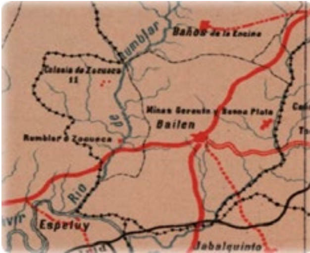
«Provincia de Jaén, reducida y publicada con la autorización competente por el Topógrafo D. José Méndez», 1885.

En 1752 lo recogió el Marqués de la Ensenada en el siguiente mapa, zona sombreada por un servidor y que contrasto con un mapa actual: