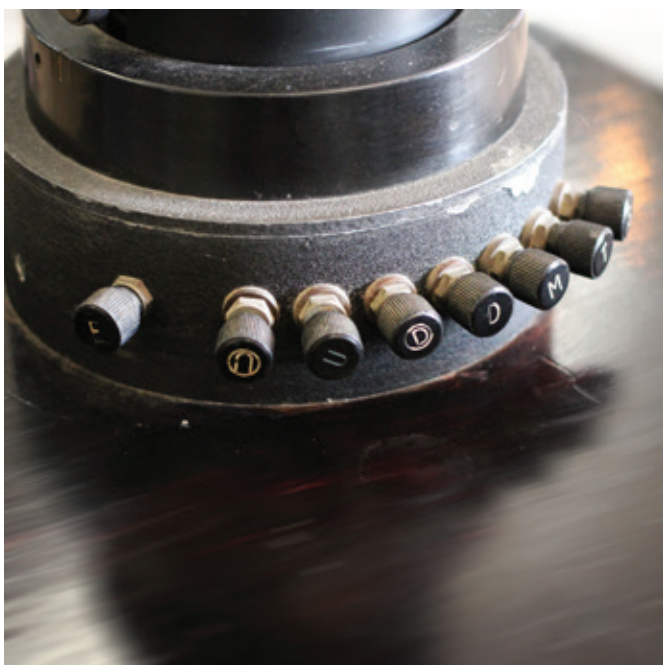
Figs. 5 y 6. Telégrafo.