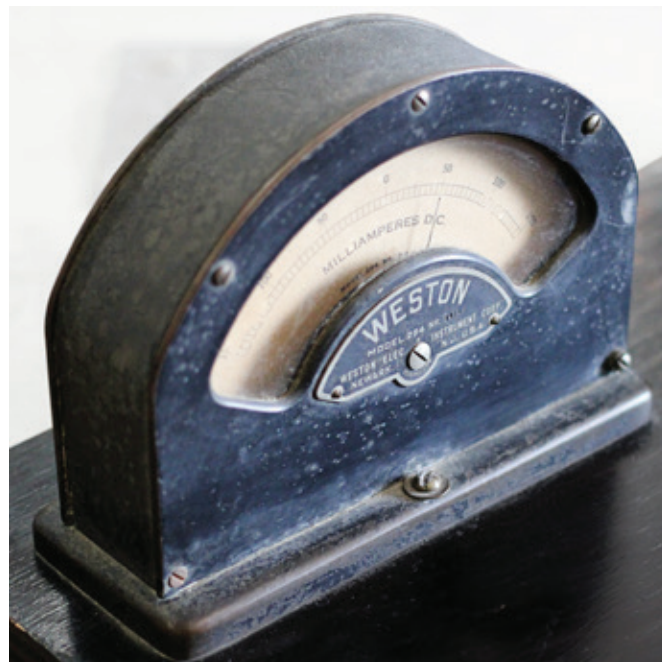
Fig. 7. Telégrafo.

También son interesantes las recreaciones virtuales de espacios que incorporan información para contextualizar el activo patrimonial. La visita virtual a la Alhambra de Granada, incluida en el portal web ArsVirtua.com, así como otros grandes monumentos o construcciones del