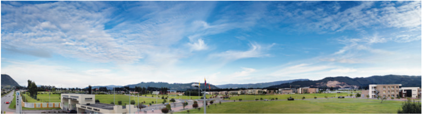
Fig. 2. Campus, Universidad Nueva Granada.

ancestrales o nativas utilizan un sistema de comunicaciones inalámbrico, conocido como maguaré , que consistía en dos tambores golpeados con un mazo de caucho que emitían señales sonoras con un código especial conocido por sus operadores. Estas eran enviadas hasta una distancia de 20 kilómetros, donde eran retransmitidos por otros y con los cuales se comunican acontecimientos importantes de las comunidades, como convocatorias a reuniones tribales, religiosas o festivas (Meyer, Dentel y Seifart, 2012).