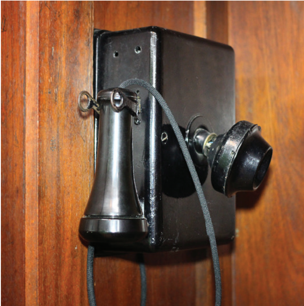
Fig. 4. Teléfono en la abina telefónica utilizada en Bogotá en los años 30 y 40.

de sus colecciones, compartir datos en línea, ofrecer información y recursos que mejoren y optimicen las visitas a través de sus páginas web, empleando la tecnología digital como una nueva herramienta de comunicación efectiva con el público que puede ser general o muy específico.