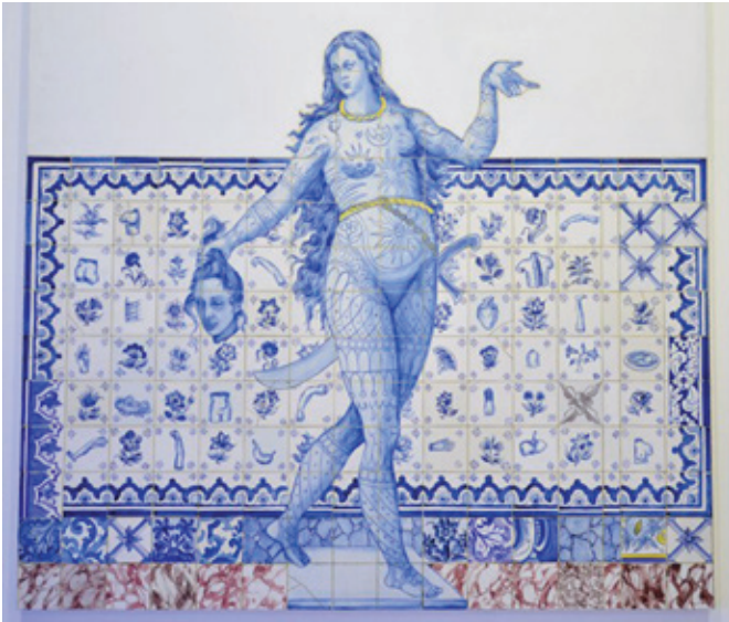
Adriana Varejão. Figura de convite II , 1998. Óleo sobre tela, 200 x 200 cm. Serie: Proposta para uma catequese .