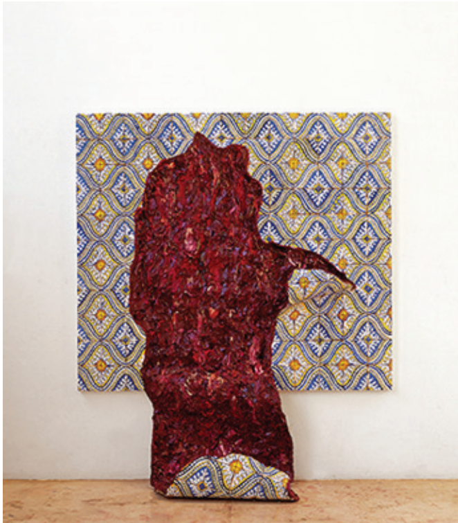
Adriana Varejão. Língua com padrão sinuoso , 1998. Óleo sobre tela e poliuretano em suporte de madeira e alumínio, 200 x 170 x 57 cm. Serie: Línguas e cortes .

En “Língua com padroe sinuoso”, la “lengua” parece ser aquel conjunto de rojos, violetas y bermellones que recrean una gran masa de carne viva que se despega con facilidad de la retícula de azulejos, como si el peso de aquella lengua no tolerase ser solapado. De este modo, esa forma abierta rompe incluso el cuadrado de la imagen para llegar hasta el suelo.