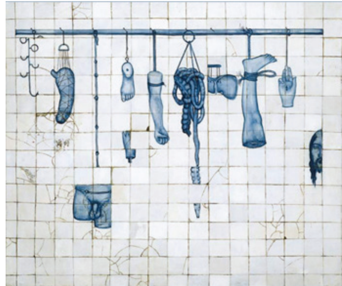
Adriana Varejão. Varal , 1993. Óleo sobre tela, 165 x 195 cm. Serie: Proposta para uma catequese .

analizar el funcionamiento de estas dimensiones en un territorio como el artístico.