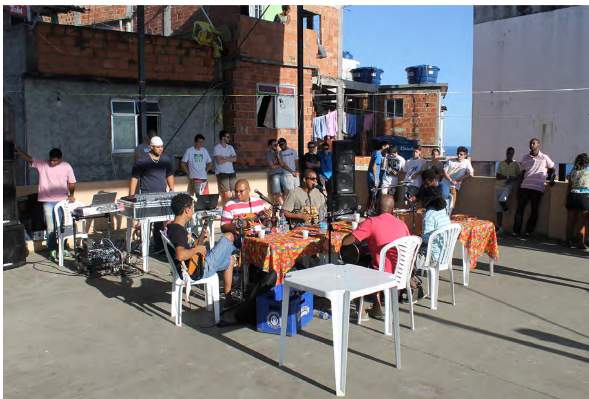
Figura 2. Roda de Samba na laje do Museu de Favela (MUF), Cantagalo-Pavão-Pavãozinho.

A imagem é construída por meio da história dos lugares, de suas tradições e de seu patrimônio —que muitas vezes são inventadas, como