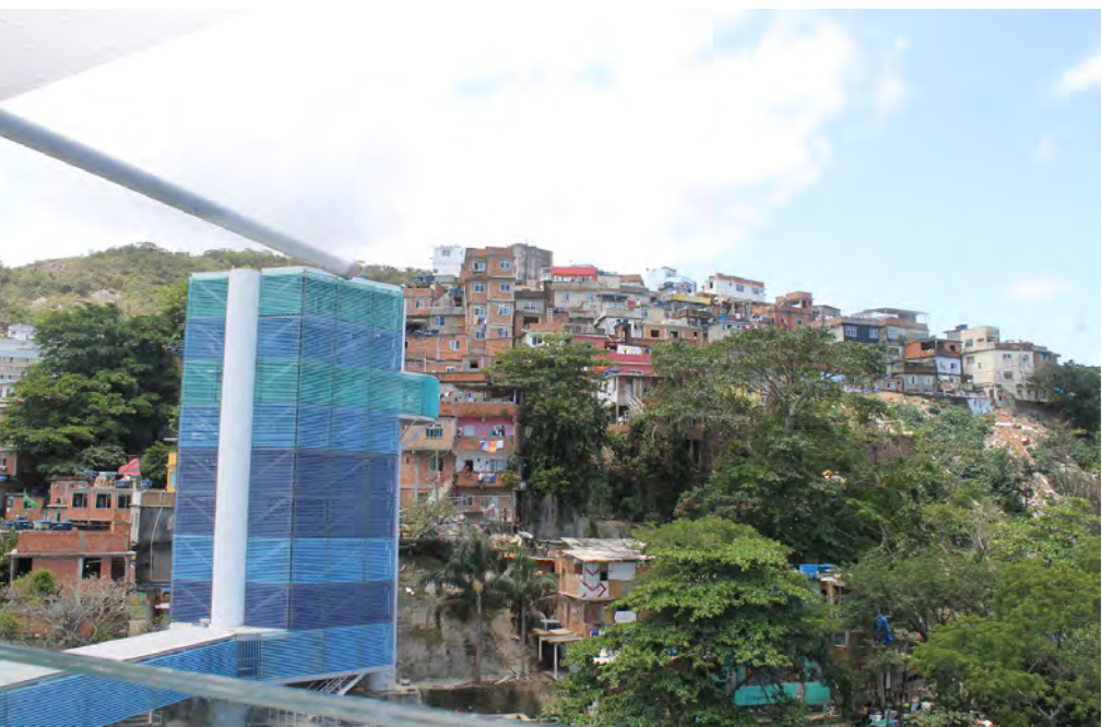
Figura 5. Panorama da favela da Rocinha.