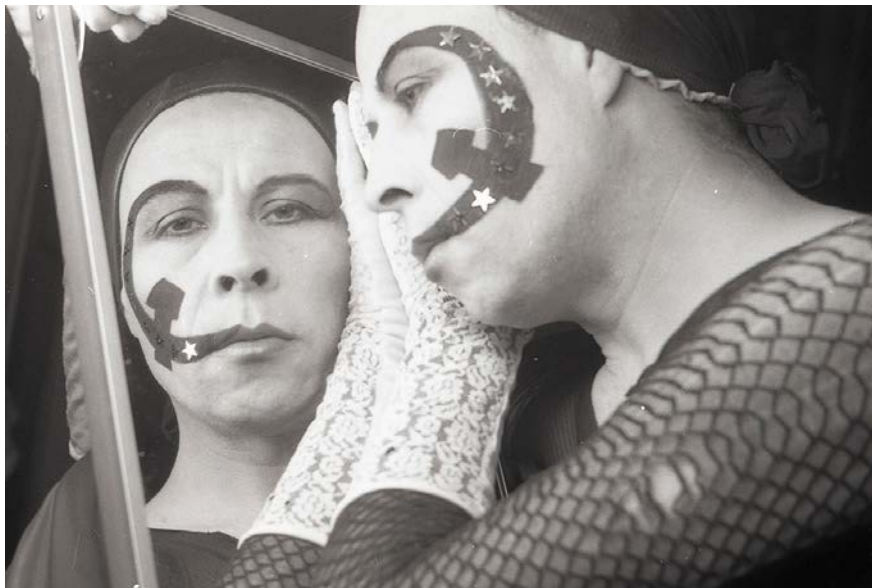
Figura 4. Manifiesto (Román, 1990)

La superposición de estas figuraciones puede observarse en otros registros de la performance de Lemebel. La fotografía Manifiesto (Román, 1990) muestra su rostro pintado con una hoz y un martillo. ¿Cita del memorable corsé de Frida Kahlo? El toque glamoroso está dado en las estrellas brillantes que decoran el emblema comunista y los guantes de encaje que afirman su otra mejilla.