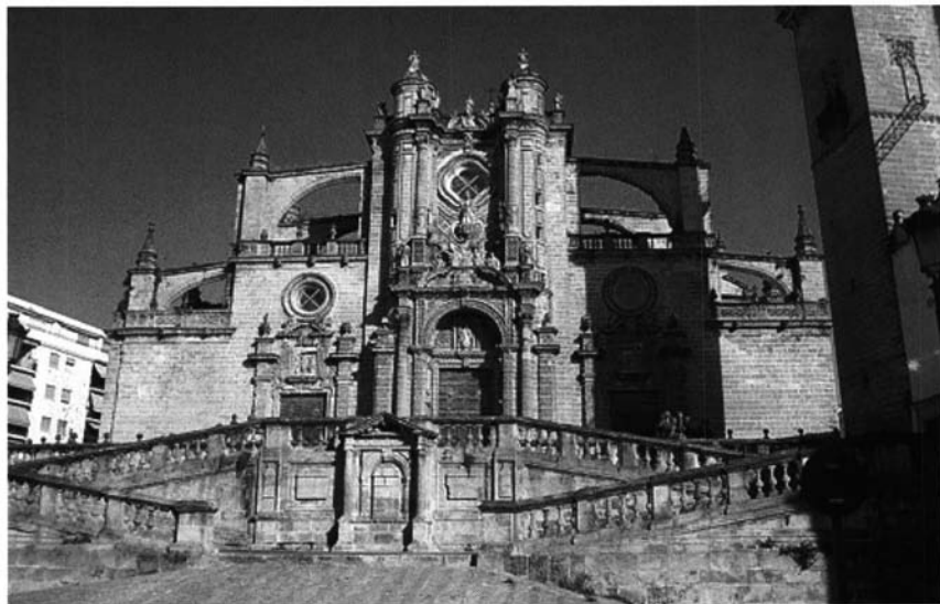
Colegiata de Jerez de la Frontera. (1695-1778).