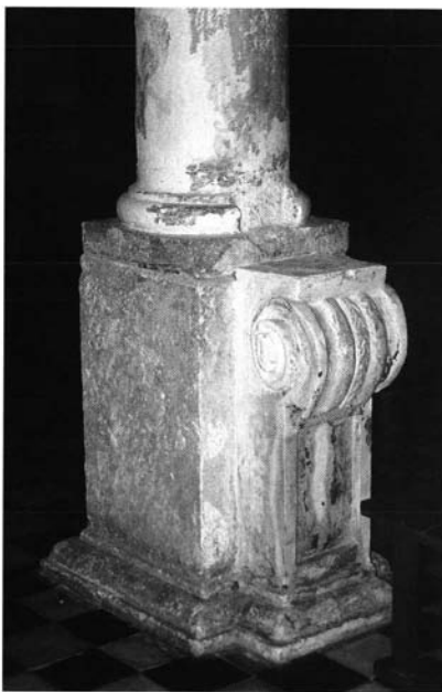
Lámina 1. Pedestal de mármol rosáceo. Tavira (Portugal)