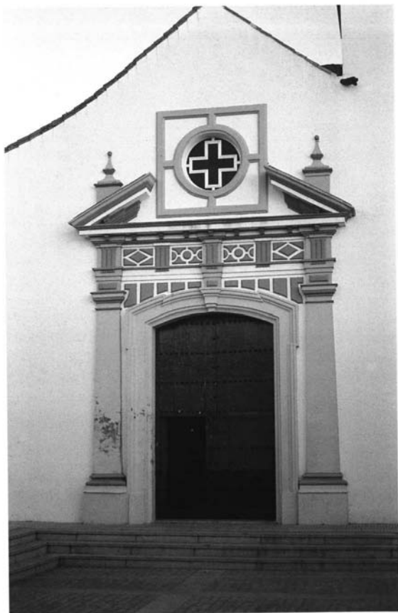
Lámina 2. Portada del hastial de orden dórico