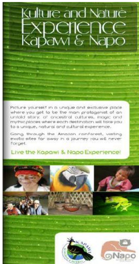
Figura 2: Folleto de la alianza estratégica entre NWC y Kapawi Ecolodge “Cultura y Naturaleza Experiencia Kapawi y Napo”