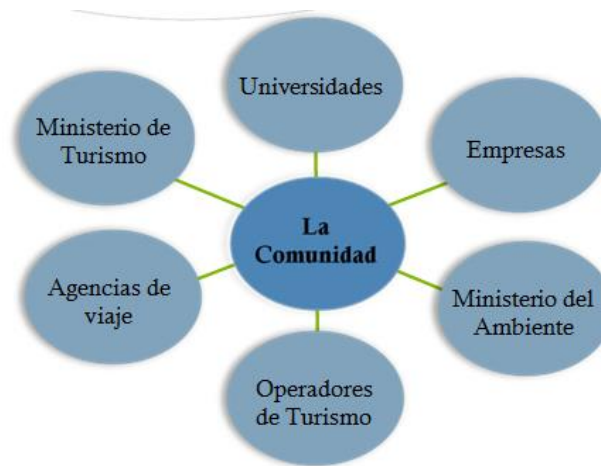
Figura 3: Esquema de la relación de los diferentes actores con la comunidad local