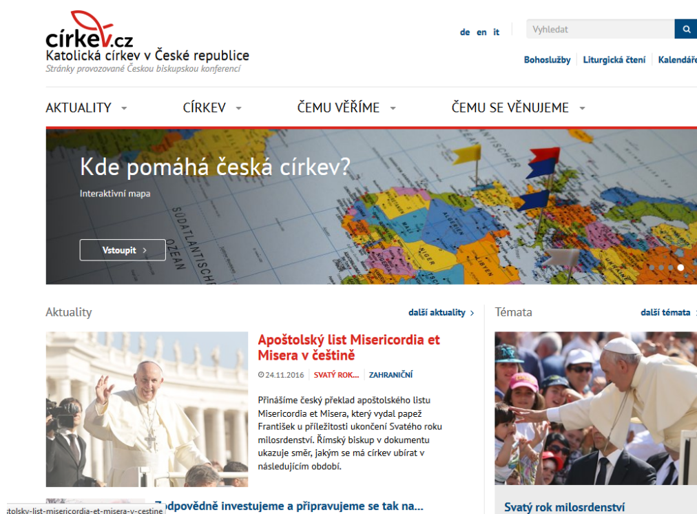
Figure 1: Screenshot of the Roman Catholic Church website ( www.cirkev.cz – 24.11.2016)