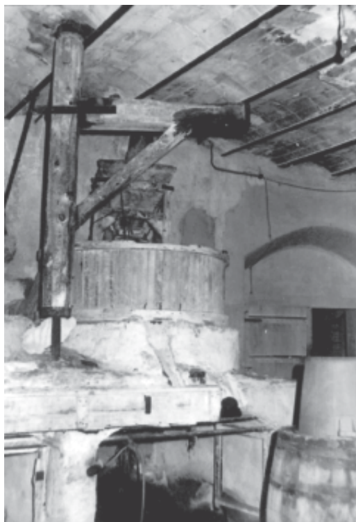
Fotos 8-9. Molí de la Vila. Detall d'una mola i del carcabà. (fotos cedides per Joan Tarès i Ramon Guasch).

Aspecte que tenia la bassa del molí de la Vila el 1924, d'on sortia la sèquia que regava els horts de la banda esquerra del Francolí (Horta de Malpartit). Un dels ramals passava soterrat per l'actual plaça d'en canós fins l'actual Museu de la Vida Rural.