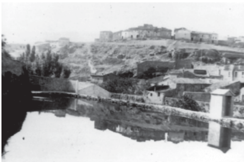
Foto 5. Retrospectiva Bassa del molí d'en Jan (1924-1928).

i el seu lloctinent a l'Espluga havien decidit de bastir un molí en aquest lloc, aprofitant l'aigua del riu de Milans. Vers el 1295 els templers bastiren el molí, no sense entrebancs per part del Monestir de Poblet que veia una intromissió dels seus drets sobre l'aigua del riu de Milans 10 . Possiblement els templers tiraren endavant la construcció del molí malgrat les reclamacions de Poblet. Vers el segle XIV aquest molí prengué el nom de molí dels Sants 11 .