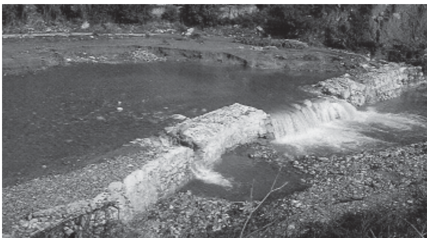
Foto 19. Peixera del molí dels Frares.

Des de la peixera del molí dels Frares sortia una sèquia que nodria la bassa del molí de Poca. Al seu pas per sota el coll Roig estava coberta amb una volta, desapareguda durant l'aiguat de 1994.