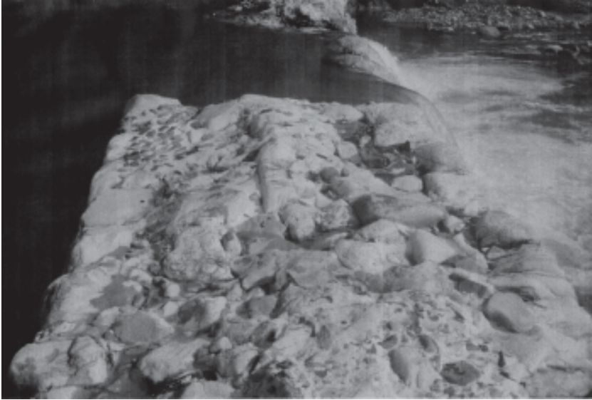
Foto 20. Detall de la peixera del molí dels Frares.

L'aiguat de 1994 deixà al descobert aquesta resclosa, on s'aprecia l'obra de fàbrica de morter de calç i pedres erosionada per la fricció de l'aigua i els sediments que arrossegà durant segles.