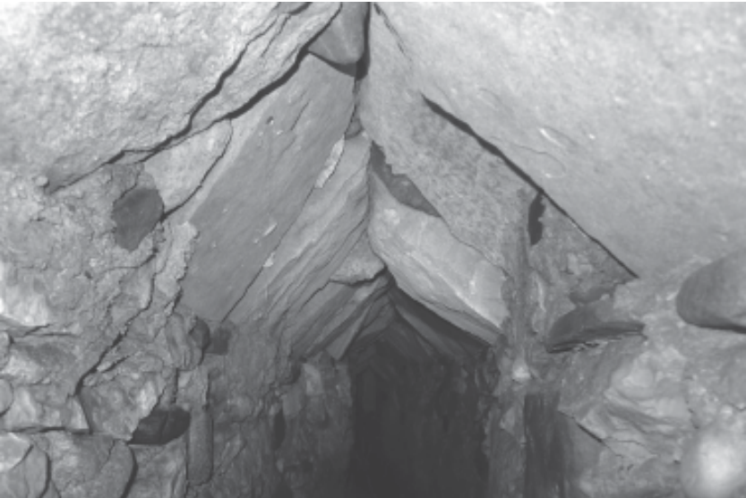
Foto 4. Sèquia del Museu de la Vida Rural. Detall de la secció amb sostre apuntat.