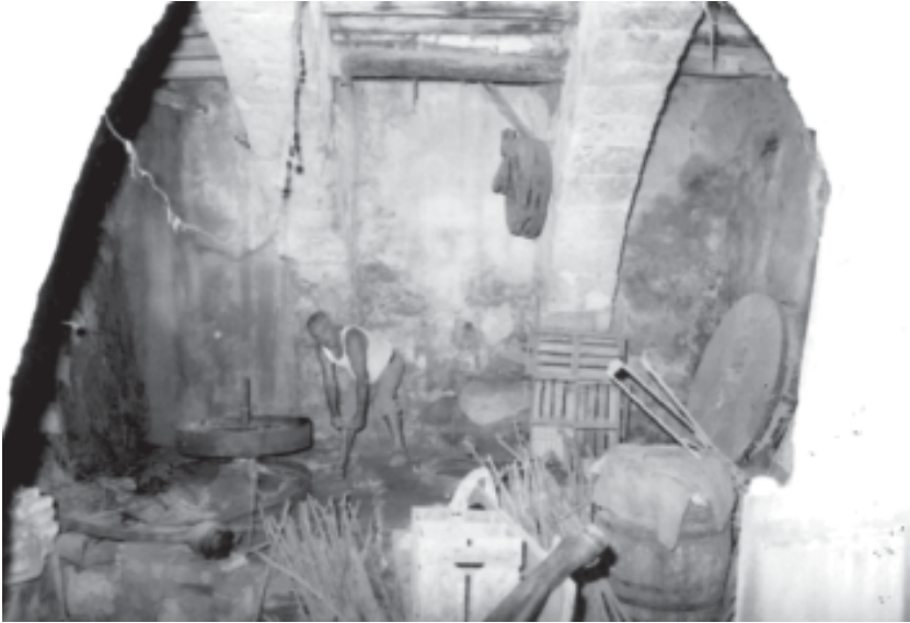
Foto 10. Molí del Bou. Interior de l'obrador on hi havia dos jocs de moles.