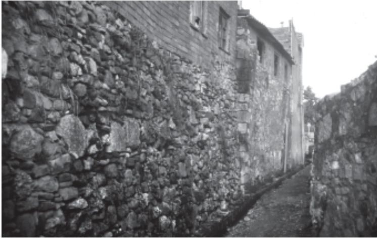
Foto 16. Sèquia del Molí de la Vila.

A l'antic camí de la Sequieta hi havia la sèquia que aconduïa l'aigua de la bassa del molí de la Vila fins el molí del Pont de la Palanca i que regava els horts de l'actual Museu de la Vida Rural. Damunt la sèquia, resta visible un tram del mur de la muralla que tancava l'Espluga Jussana. Actualment aquesta sèquia ha estat soterrada i pavimentat el vial.