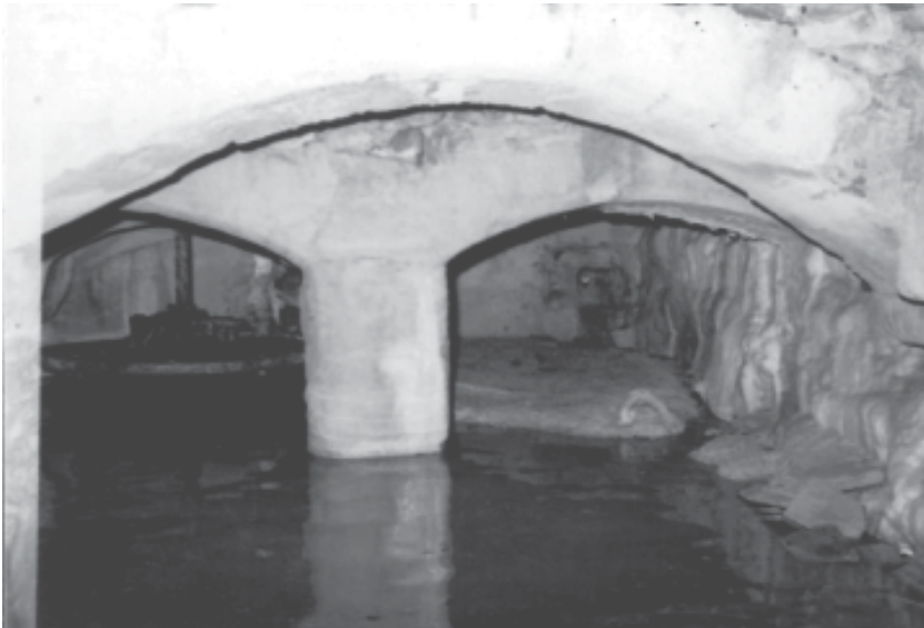
Foto 11. Molí del Bou. Detall del carcabà i la turbina.