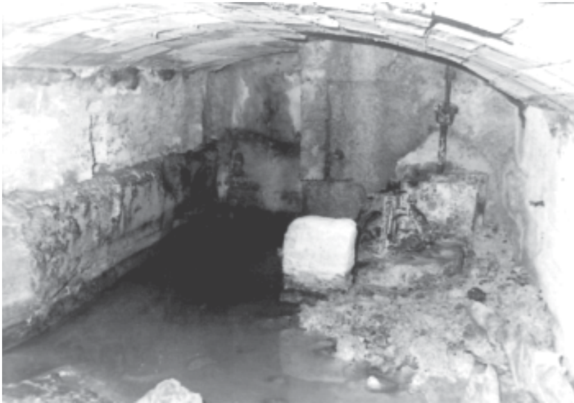
Foto 9. Molí de la Vila.

Molí del Pont de la Palanca. A la riba esquerra del riu Francolí existia un casal de molí que agafava l'aigua de la sèquia del molí de la Vila 16 .