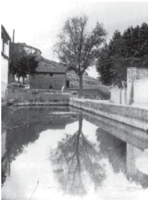
Foto 7. Bassa del molí de la Vila.

Aspecte que tenia la bassa del molí de la Vila el 1924, d'on sortia la sèquia que regava els horts de la banda esquerra del Francolí (Horta de Malpartit). Un dels ramals passava soterrat per l'actual plaça d'en canós fins l'actual Museu de la Vida Rural.