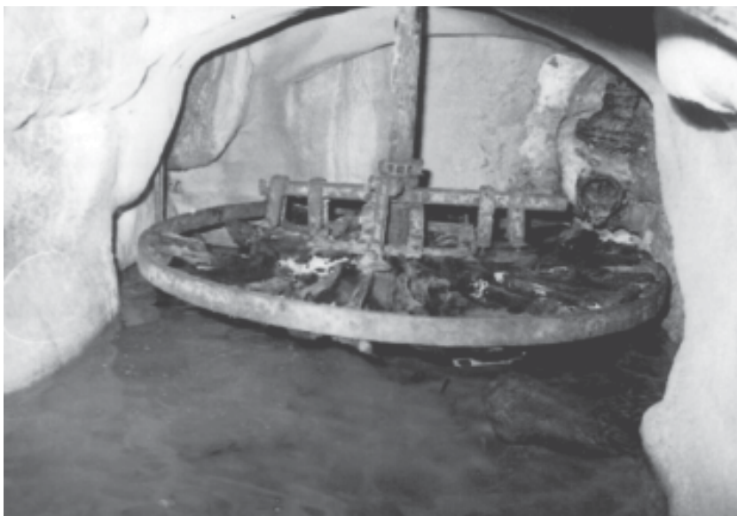
Foto 12. Molí del Bou. Detall de la turbina (foto de Joan Tarès, 1983).

Molí dels Frares. Denominació que actualment rep un molí existent a la mateixa riba dreta del Francolí, sota el coll Roig, al costat d'una resclosa que entolla el riu. Es nodreix d'un doll d'aigua que omple la bassa del molí i de les aportacions de la sèquia procedent del molí de Pinós. Històricament cal emmarcar-lo com un dels molins construïts per Pere de Pinós i que també degué ser venut a Pere Ponç de Segura el 1160. Al començament del segle XIII el tenia Ramon de Pinós, segons es desprèn dels documents apuntats 26 .