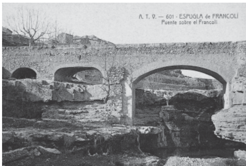
Foto 15. Salt del riu Francolí. Pont i gorg del Francolí en el seu pas per la Font Baixa a començament del segle XX.

Aquesta sèquia, en temps de secada, podia alimentar-se mitjançant un estellador al riu de Milans en les mateixes roques de la Font Major. Per tant, dues sèquies principals fornien els molins de l'Espluga Sobirana, alhora que la sèquia de la Font Major que s'originava a l'Espluga Sobirana nodria els molins de l'Espluga Jussana.