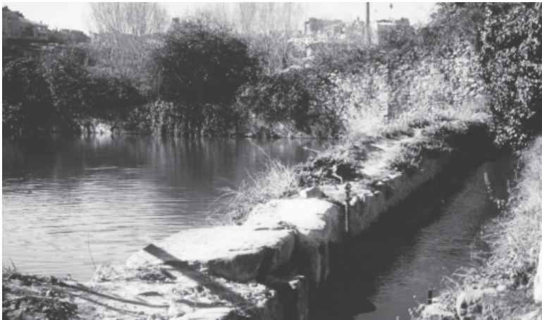
Foto 17. Sèquia i bassa del molí del Bou.

A l'antic camí de la Sequieta hi havia la sèquia que aconduïa l'aigua de la bassa del molí de la Vila fins el molí del Pont de la Palanca i que regava els horts de l'actual Museu de la Vida Rural. Damunt la sèquia, resta visible un tram del mur de la muralla que tancava l'Espluga Jussana. Actualment aquesta sèquia ha estat soterrada i pavimentat el vial.