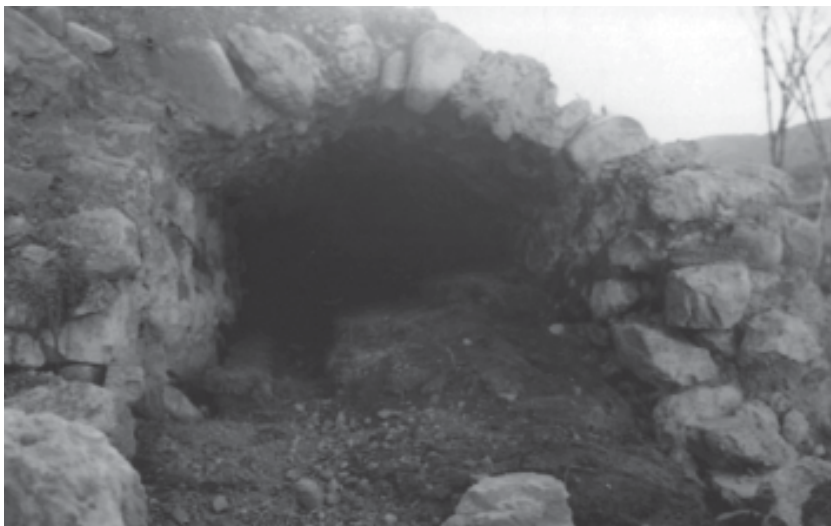
Foto 18 . Sèquia del coll Roig.

Des de la peixera del molí dels Frares sortia una sèquia que nodria la bassa del molí de Poca. Al seu pas per sota el coll Roig estava coberta amb una volta, desapareguda durant l'aiguat de 1994.