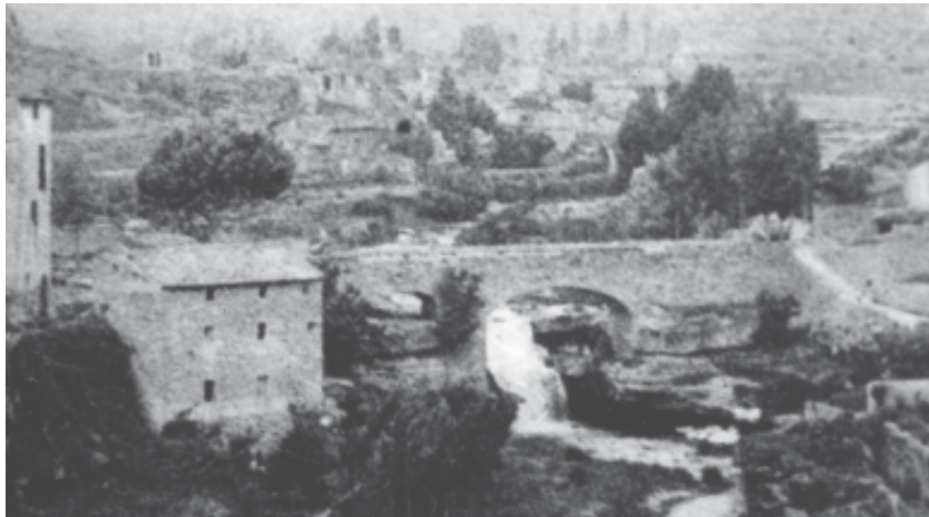
Foto 6. Molí de la Vila.