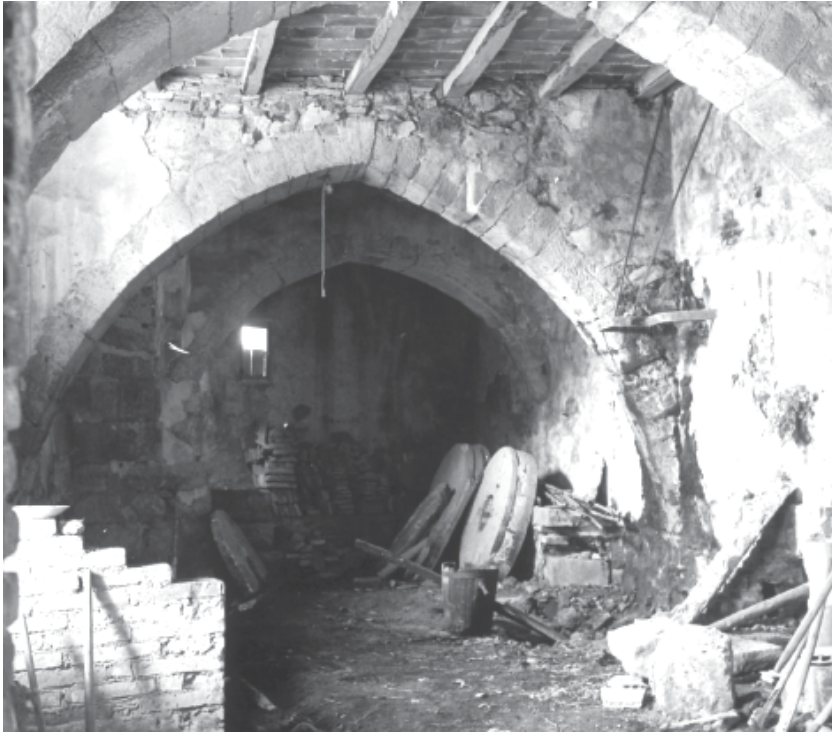
Foto 13. Molí dels Frares. Interior de la sala de les moles, 1948

Molí de Poca. És el nom que rep, possiblement des del segle XVII 30 , el molí situat a la riba dreta del Francolí, just al límit amb el terme de Montblanc (plans d'en Jori), i a la partida del mateix nom de l'Espluga, i tocant per migjorn amb la partida de l'Espadella, sota la muntanya de la Tossa. És un molí que es nodria de l'aigua de la sèquia de la Sinoga que prenia l'aigua de la resclosa aixecada al Francolí sota el coll Roig i just després del molí dels Frares.