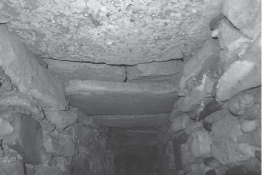
Foto 3. Sèquia del Museu de la Vida Rural. Detall del sostre adintellat d'una de les seccions de la sèquia.