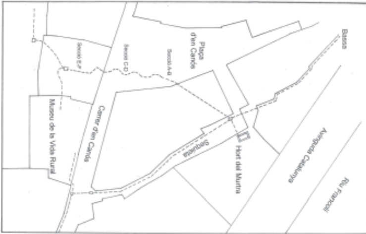
Planol 1. Recorregut de la Sequieta des de l'antiga bassa del Molí de la Vila fins el carrer Canós i el seu ramal subterrani que travessa amb trams de zig-zaga la plaça d'en Canós fins al Museu de la Vida Rural (dibuix Ramon Rosich).

La importància d'aquest rec rau en les seves dimensions i soterrament, a la vegada que està situat en un punt amb gran potencial didàctic i en el fet que esdevé un exponent dins el conjunt del sistema de regatge derivat de les sèquies i molins de l'Espluga durant l'edat mitjana.