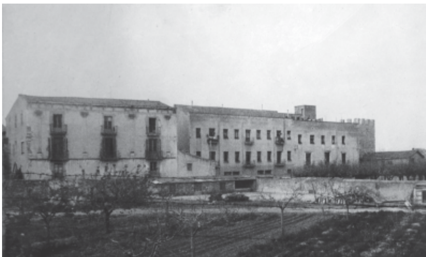
Vista de la zona abans de l'enderroc de l'antic hort del convent de Sant Francesc.

D'aquesta finca es va segregar posteriorment el tram més occidental, on hi havia l'antiga fassina, mentre que la resta de la casa, que havia