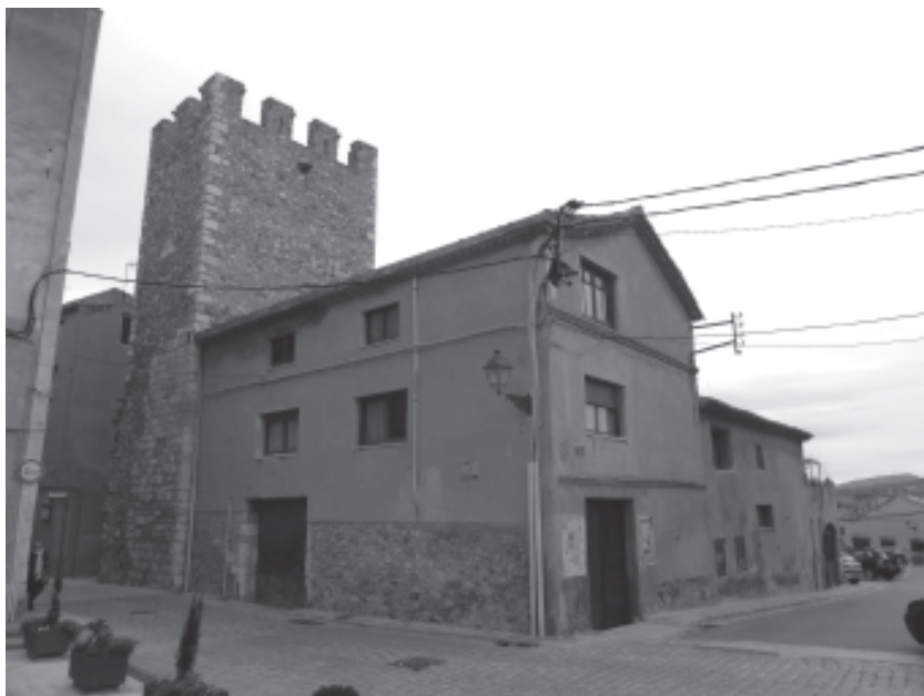
Vista de l'edifici actual de cal Masalles, adossat a l'exterior de la torre i del llenç de la muralla medieval de Montblanc

la muralla. En anys successius es documenta la venda de diverses parcel·les d'aquest hort, sense referències explícites a que la compra estigui vinculada a la construcció de cases en aquest sector. No hem pogut determinar amb exactitud l'extensió total d'aquest hort, però pel que sabem aniria almenys des de la torre de cal Masalles (Torre 15) fins a la segona torre després del portal del Castlà (Torre 10). Pel que fa a les seves dimensions, sembla que ocupava tota la franja compresa entre la muralla i el camí que vorejava la vila.