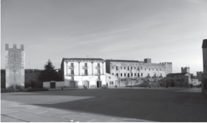
Vista general de les edificacions adossades a la muralla a la banda de ponent del portal de Sant Francesc. Al'extrem esquerre la torre, cal Contijoch, cal Ferreret i l'edifici del Kursaal