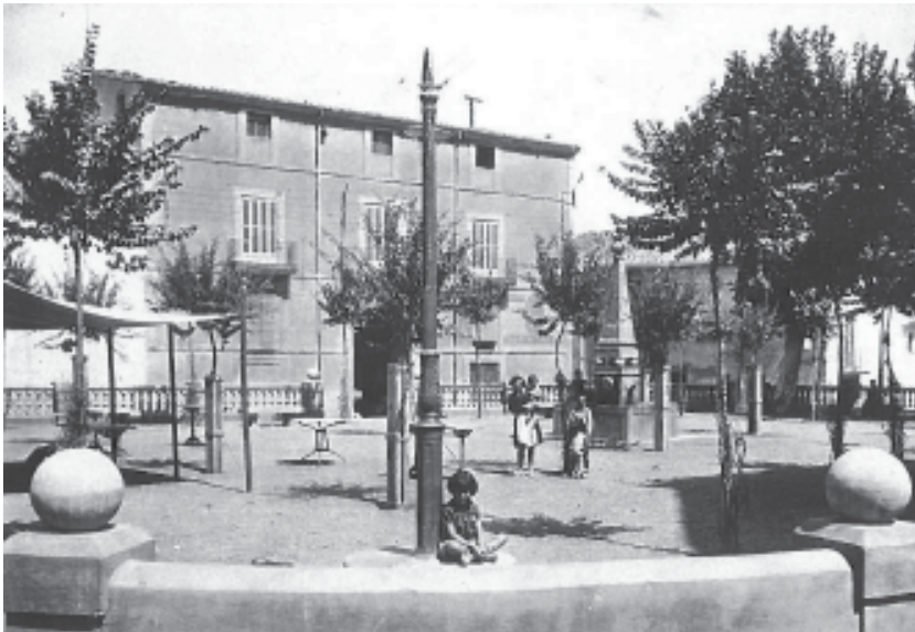
Vista de la casa que ocupava el tram més proper al carrer Major cap al 1920, abans que la construcció de l'edifici del Kursaal en desdibuixés completament la fesomia

Contijoch, amb tres crugies paral·leles i parets fetes amb paredat de pedra i calç. Presentava planta baixa, entresòl, pis i golfes. La porta principal se situava a la banda de la plaça, al centre de la crugia central, i es corresponia amb un portal de perfil rectangular, de grans dimensions des del que s'accediria segurament a un vestíbul i a una caixa d'escala central que comunicaria amb els pisos superiors. En les fotografies que se'n conserven, a banda i banda de la porta s'aprecien dos nivells de finestres corresponents a la planta baixa i l'entresòl de les crugies laterals. En la planta principal destaquen tres balcons, un per cada crugia, que encara es conserven, mentre que a les golfes es veuen finestres de petites dimensions, parcialment tapiades. No sabem com era la façana posterior, que donava al carrer Muralla d' Alfons I, tot i que per similituds amb cal Contijoch segurament disposava també de tres nivells de finestres, un per cada pis, i possiblement també d'una porta que comunicava la casa amb el carrer a l'alçada de l'entresòl. L'edifici era cobert amb una teulada a doble vessant centrada a l'eix longitudinal de la finca, fet que la diferencia de cal Contijoch on el carener se situa en un punt força avançat en relació amb la façana.