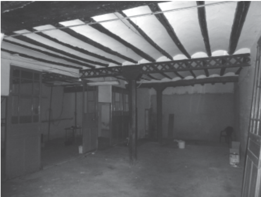
Vista de l'interior de la planta baixa de cal Masalles abans de les obres de 2016