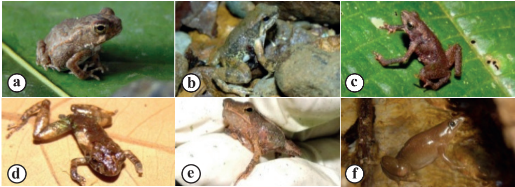
Figura 1. Tipificación de especies encontradas en el área de estudio de acuerdo a su abundancia. Especies dominantes a: Rhinella marina , b: Hyloxalus bocagei y c: Amazophrynella minuta . Especies menos dominantes d: Pristimantis prolatus , e: Rhinella festae y f: Synapturanus rabus .