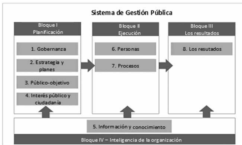
Figura 1. Modelo de Excelencia en Gestión Gespública.