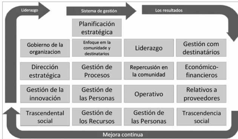
Figura 3. Modelo para una Gestión de Excelencia – Organizaciones sin fines de lucro.