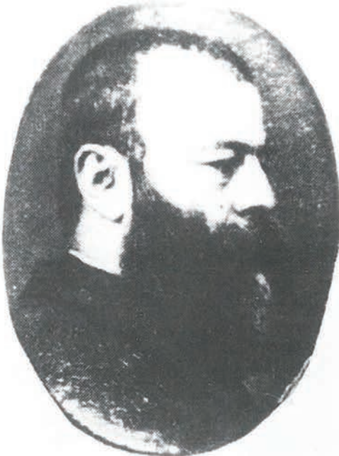
Federico Rubio y Gali (1827-1902).