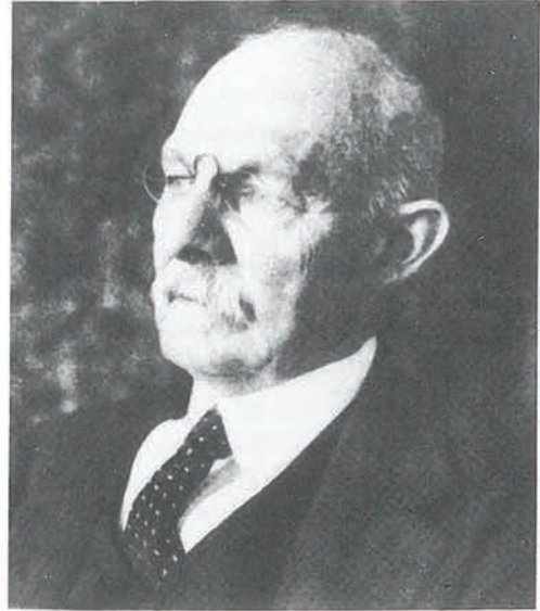
William S. Halsted (1852-1922).