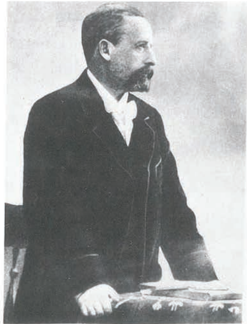
Johannes V. Mikulicz-Radecki (1850-1905).