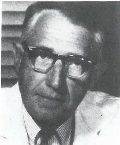
Francis D. Moore (n. 1913), cirujano investigador destacado quien definió aspectos objetivos del metabolismo en pacientes quirúrgicos.