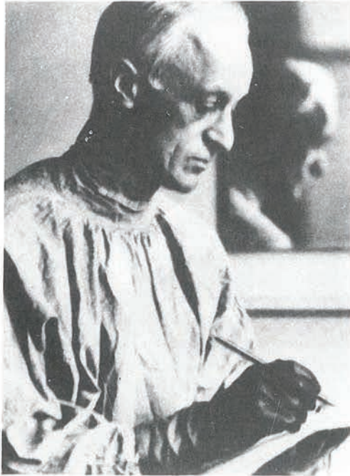
El neurocirujano Harvey Cushing.