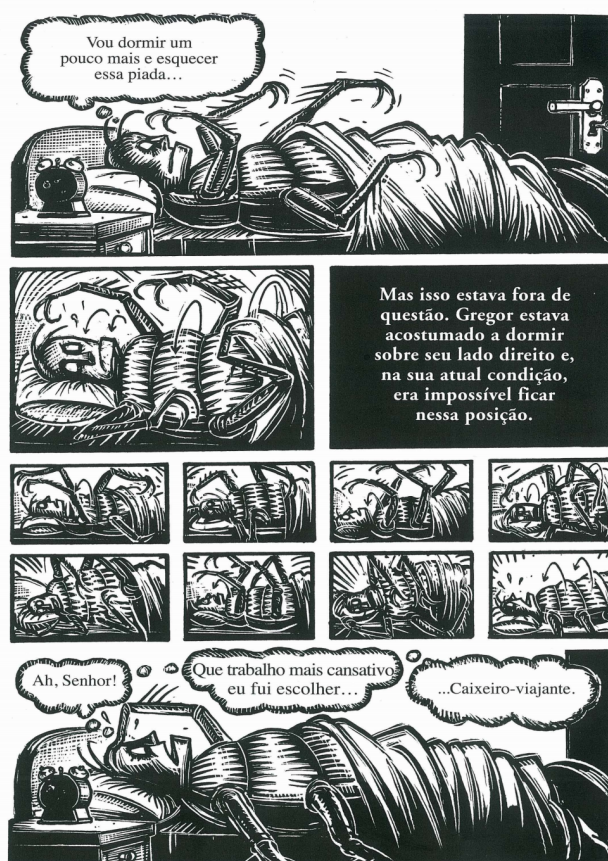
Figura 3: “Ainda que usasse toda a força para jogar-se para o lado direito, sempre retornava à posição inicial...” (Kafka, 2002, p. 8; Kuper, 2004, p. 13).

Do lado do verbal, seja encerrada no balão de pensamento, seja enquadrada no quadrinho retangular, a “palavra” traz à luz a racionalidade operante do homem. Em atitudes racionais, Gregor decide dormir, e o narrador comenta a impossibilidade de que isso aconteça. A natureza humana resiste bem no verbal. Mas a metamorfose inacabada sincreticamente faz o leitor vivê-la num fluxo temporal. A dupla identidade do homem-barata no todo sincrético vincula a percepção a uma unidade contínua da consciência do tempo. Dilacera-se a percepção de um tempo pontual, o que se transpõe do visual para o verbal. O tempo dura – na percepção de um “presente vivo”. Entre retenções do passado (Gregor ainda homem) e protensões antecipatórias (a barata completa) temos o campo de percepção . A HQ constrói a temporalização da experiência sensível, ao apresentar a percepção como da ordem do contínuo, do fluxo ou da passagem. O tempo apresentado como duração é orientado pela fusão sincrética. A Figura 4 o comprova (cf. Figura 4).