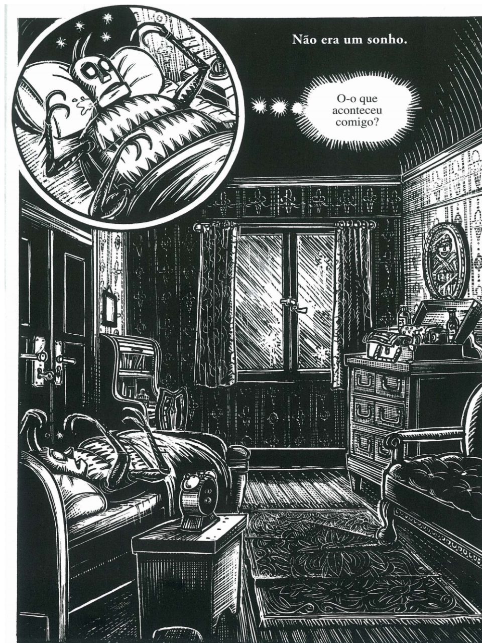
Figura 1: “Ao acordar naquela manhã de sonhos perturbadores, Gregor Samsa viu-se transformado...” (Kuper, 2004, p. 12).