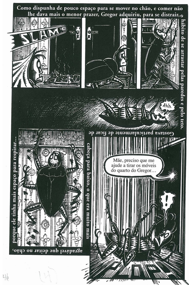
Figura 4: “Gostava particularmente de ficar de cabeça para baixo.” (Kuper, 2004, p. 46)

Afinada a esse tipo de relação das partes (o verbal e o visual) com o todo sincrético, as diferentes linguagens de manifestação, no caso da mescla, interseccionam-se numa lógica implicativa (se x no verbal, logo, y no visual – e a recíproca é verdadeira). A estratégia de sincretização prepara o efeito de previsibilidade. Afastada da surpresa, a percepção do mundo narrado alia-se ao princípio de descontinuidade, que permite ver os contornos das coisas. No sincretismo por mescla, há descontinuidade também na intersecção entre passado e presente: o passado se mantém encapsulado nas lembranças provocadas por uma memória voluntária (secundária, porque controlada pelo querer do sujeito). O ato de enunciar não se impregna da percepção de um “presente vivo”. A mescla sincrética provoca o abatimento da experiência sensível. Domina o logos (palavra e razão) sobre o pathos (sofrimento e paixão). Não é convocado o ajustamento sensível entre os corpos do herói e do leitor. A leitura pode desenvolver-se de modo mais rápido, enquanto o ela que criva a temporalidade se apresenta atenuado. Esse ela, que passa a ser minimizado, mantém-se breve e