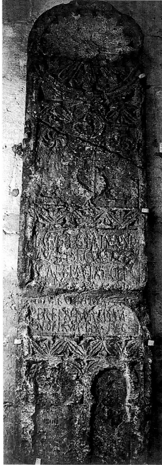
Fig.2. Inscripción funeraria de Lucio Campilio Paterno (Museo Arqueológico, León)

De acuerdo con su cronología y las características que encierra el sistema de reclutamiento ( conscriptio ) a partir de las décadas finales del siglo I tras las reformas militares de Vespasiano al respecto 36 , parece lógico suponer que este soldado sería originario de algún territorio próximo al lugar de estacionamiento de la unidad militar a la que pertenecía, por lo que el suelo habitado por los astures pudo haber sido el propio de su nacimiento.