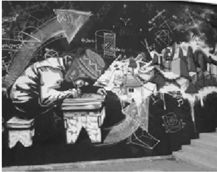
Figura 5. Armando el viaje.

En este momento se introduce la noción/opción de marcha por ruta conocida o por rutas de incertidumbre (a la deriva); se discute sobre el valor, el sentido y el alcance de las mismas. A partir de ello se definen rutas básicas o específicas, se seleccionan acciones a realizar desde los intereses y condiciones planteados en las fases anteriores.