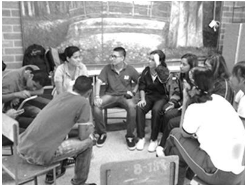
Figura 3. Confrontando Visión.