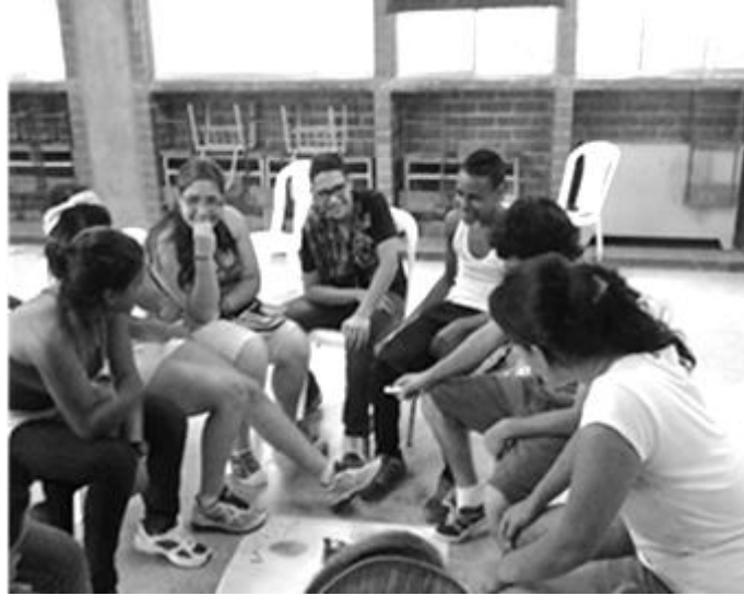
Figura 4. Negociando problema.

Este momento tiene como finalidad visibilizar en conjunto la existencia de un problema de investigación a partir de las reflexiones del equipo investigador sobre la relación escuela/ciudad que permita la formulación de la pregunta de investigación. Esta pregunta debe recoger los problemas que se visibilizaron en el primer momento, las expectativas e intereses de las partes interesadas, orientar el proceso de objetivación y la selección de actividades de la experiencia investigativa.