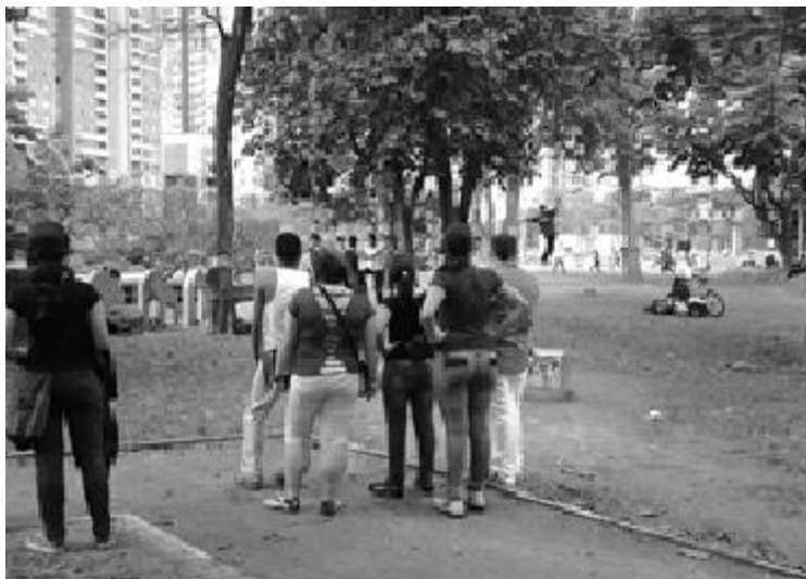
Figura 6. Redescubriendo lugares y no lugares.