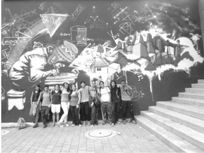
Figura 1. El grupo de investigación. Salida Parque Arví