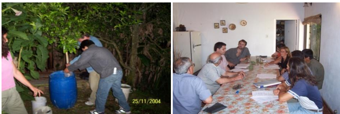
Figura 2. Ensayos participativos (2004).

En el segundo año del ensayo en la parcela, los resultados no fueron los esperados por el equipo técnico ya que el control sanitario propuesto no fue eficaz y en consecuencia las vides perdieron una buena parte del follaje y la uva no logró madurar. Si bien las bayas no tenían la calidad para hacer un vino tinto por la falta de color, se elaboró un vino espumante en las instalaciones de la FCAYF (2007) que impactó favorablemente para salvar el contenido de la propuesta de experimentación de los investigadores.