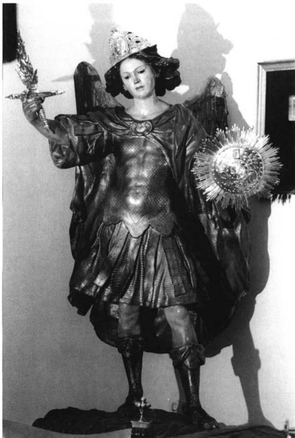
Figura 2. Escultura de San Miguel. Atribuida a la Escuela de Pedro Roldán.