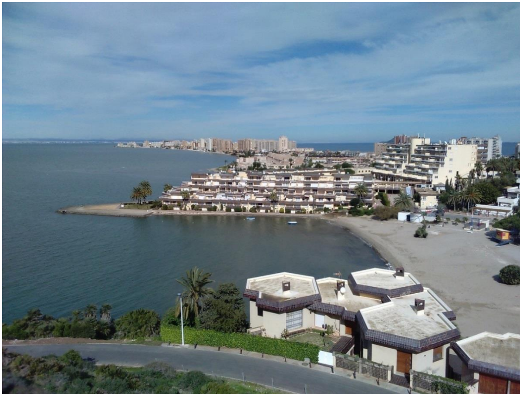
Figura 1. Construcciones turísticas en La Manga del Mar Menor