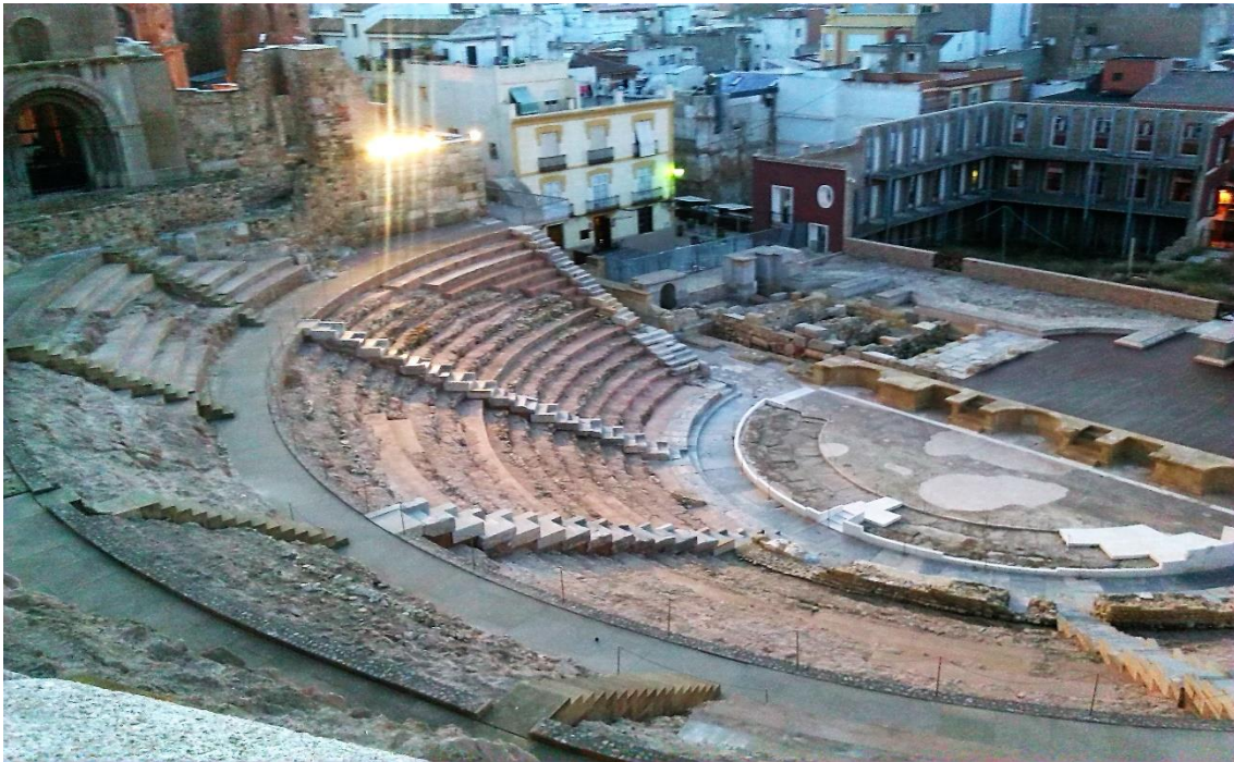
Figura 7. Teatro Romano de Cartagena