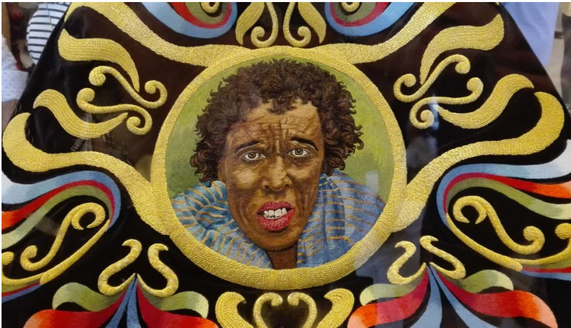
Figura 5. Pieza de bordado lorquino