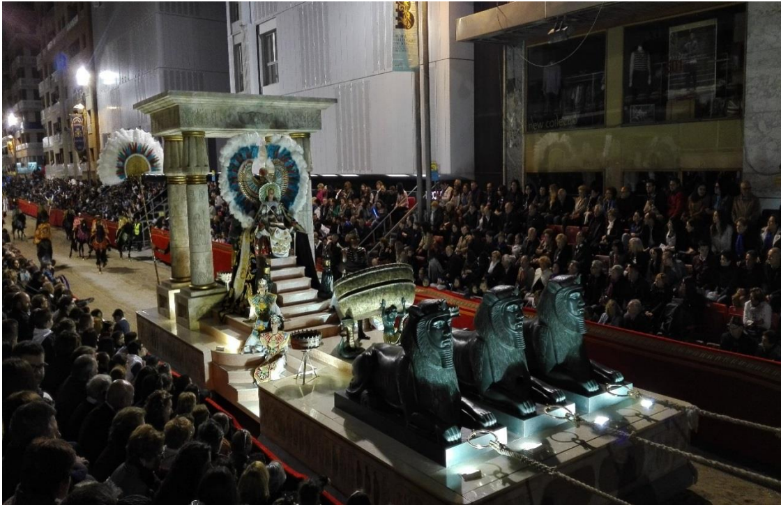
Figura 4. Desfiles Bíblico-Pasionales de la Semana Santa de Lorca