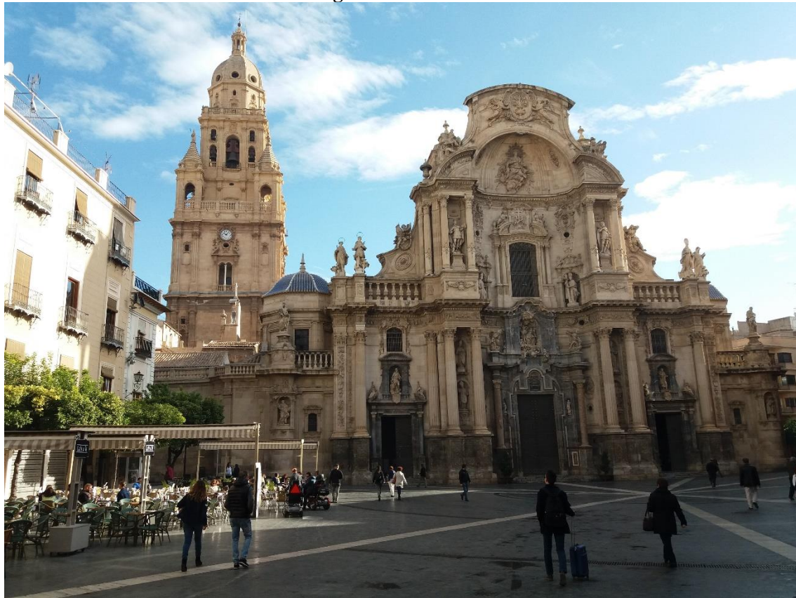
Figura 6. Catedral de Murcia