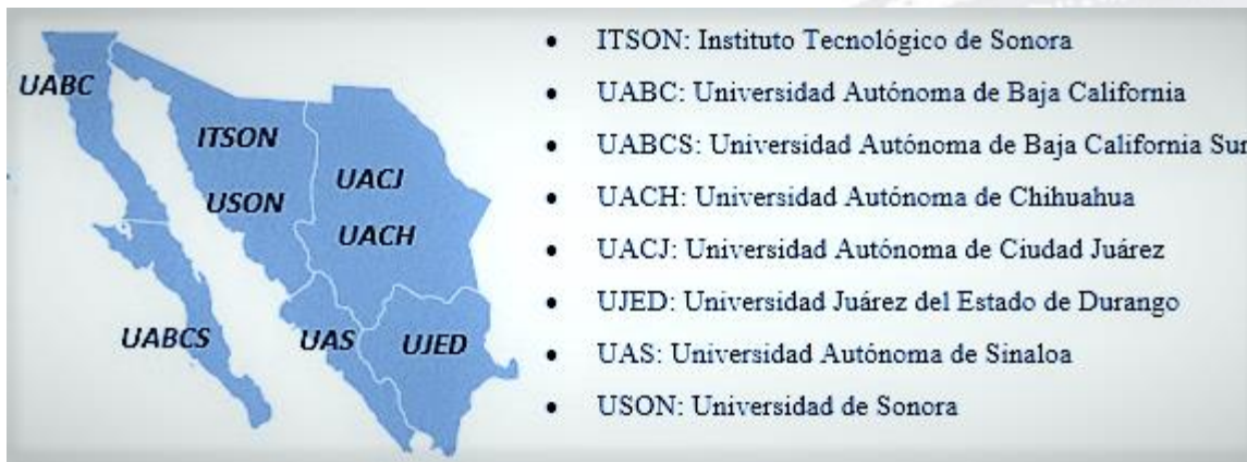
Figura 1. Universidades Públicas Estatales (UPE) del Noroeste de México.

Existen en México 34 Universidades Públicas Estatales (UPE) las que, según el Anuario Estadístico de Educación Superior de la ANUIES (2016), durante el periodo 2014-2015 atendieron a 1, 022,983 estudiantes de educación superior, lo que representa el 39.6% de la matrícula total atendida por las 915 Instituciones de Educación Superior (IES) con financiamiento público. En las ocho UPE ubicadas en los estados del noroeste del país (Figura 1), durante el mismo periodo se atendieron un total de 244,274 estudiantes del nivel superior (Técnico Superior Universitario y Licenciatura en modalidad escolarizada y no escolarizada). De ahí la importancia de estas instituciones en la región, por la atención del 47% del total de estudiantes universitarios, incluyendo aquellos que cursan sus estudios tanto en instituciones públicas como en privadas.