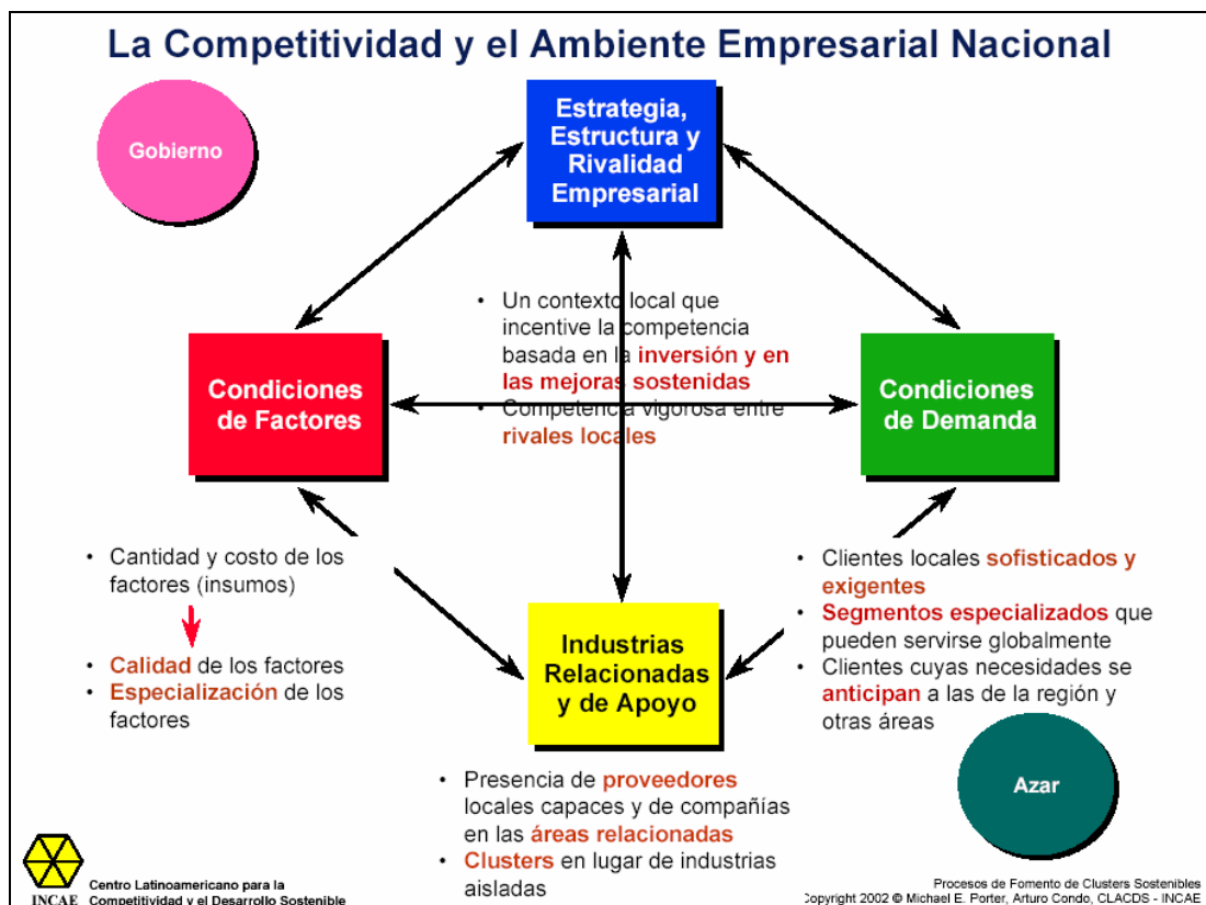
Figura 1. El Diamante de Porter.

políticas para el desarrollo de la competitividad de naciones o sectores como el caso de Centroamérica (Niels et al. , 2015).