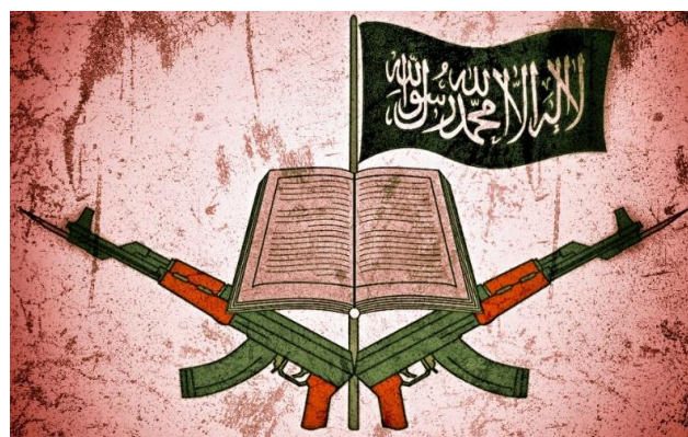
Figura 1 Emblema de Boko Haram

El 21 de junio de este año, el Consejo de Seguridad aprobaba, tras trabajosas negociaciones, la Resolución 2359 1 que da respaldo internacional al despliegue de la Fuerza Conjunta del G-5 Sahel 2 . El objetivo de esta fuerza es «hacer frente a los efectos del terrorismo y la delincuencia organizada transnacional, entre otras cosas mediante la realización de operaciones militares conjuntas de lucha contra el terrorismo a través de sus fronteras».