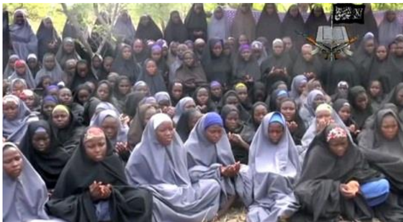
Figura 3 enviada por la organización terrorista donde muestra a parte de las niñas secuestradas.

mencionados sino ampliando su radio de acción a Malí, República Centroafricana, Benín, Níger, Sudán y Libia. En definitiva más motivos para frenar esa amenaza.