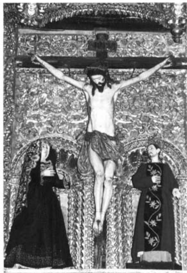
5.- Crucificado de La Compañía, Arequipa.