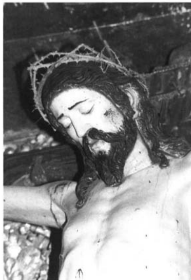
6.- Detalle del Crucificado de La Compañía, Arequipa.