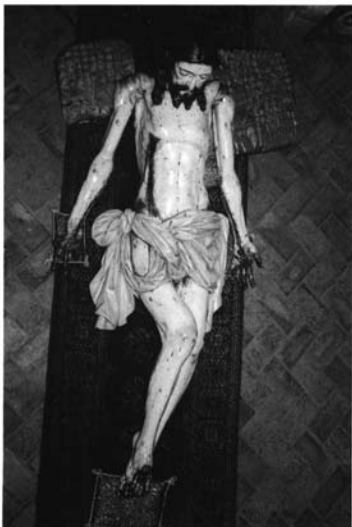
3.- Yacente del Santo Sepulcro, Templo de Santo Domingo, Arequipa.