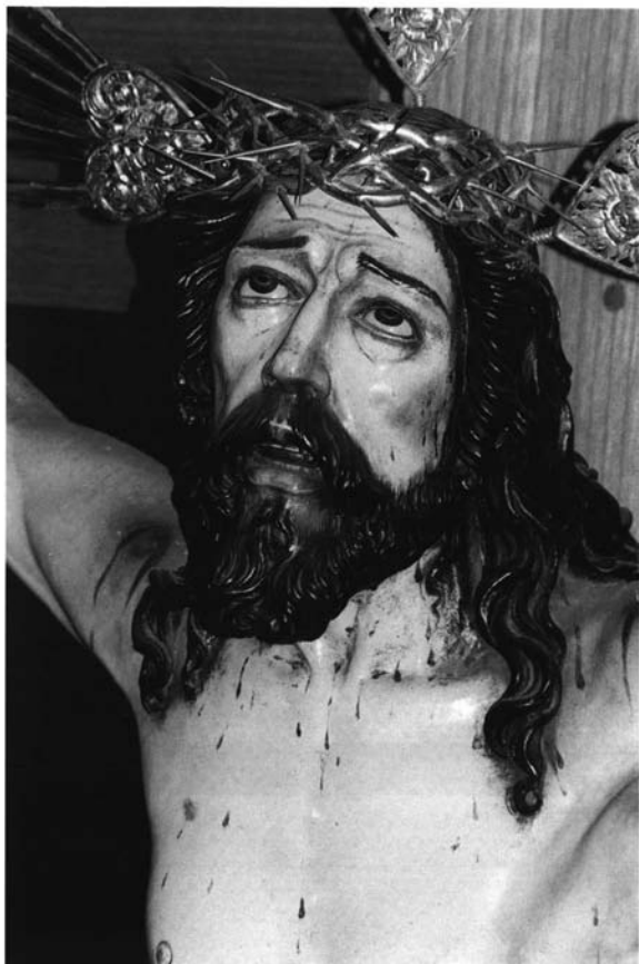
2.- Crucificado de la Vera Cruz, Templo de Santo Domingo, Arequipa (1662).