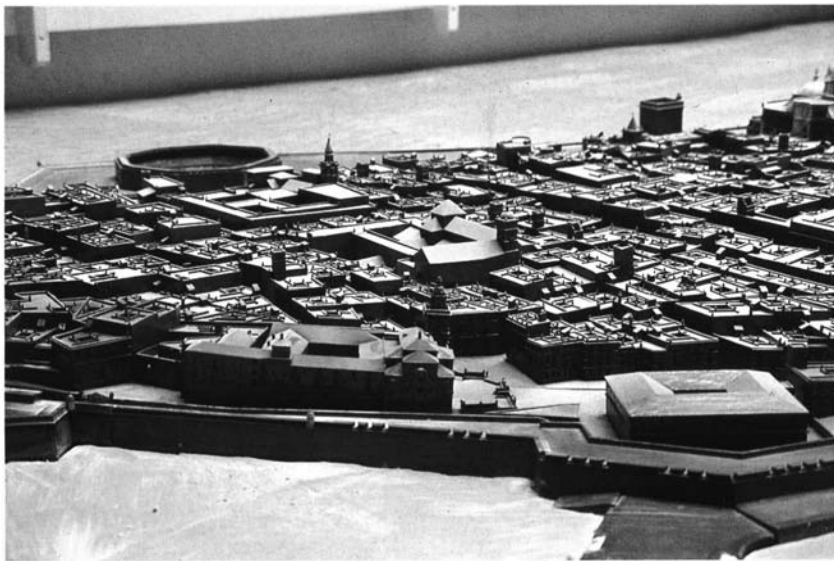
3.- Maqueta de Cádiz. Detalle de la trama urbana con la desaparecida Plaza de Toros al fondo.