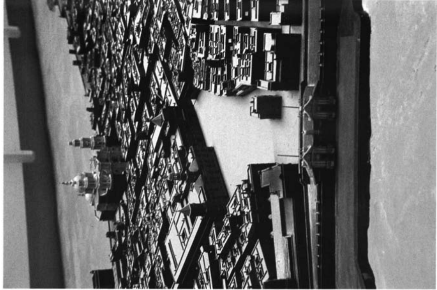
2.- Maqueta de Cádiz. Detalle de la trama urbana con la plaza de San Juan de Dios al centro.