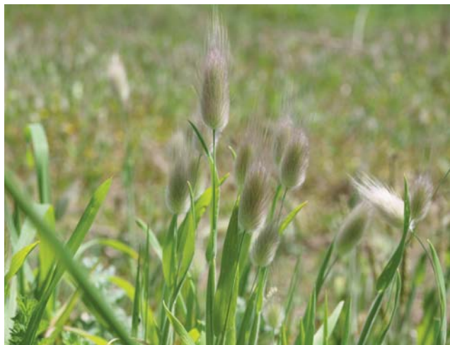
Figura 9.- Lagurus ovatus L. en Mar de Fóra

Citada por Lago Canzobre et al. , (1989a) en la zona.