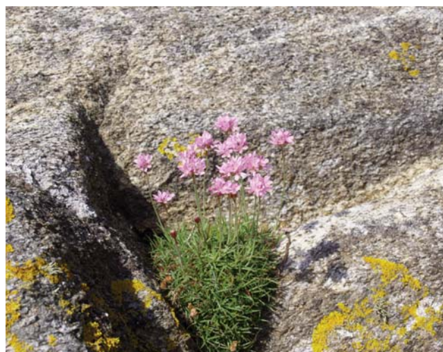
Figura 4.- Armeria pubigera (Desf.) Boiss. en los acantilados de Punta Alba do Sur

Presente en Francia y en la Península Ibérica, excepto en el suroeste.