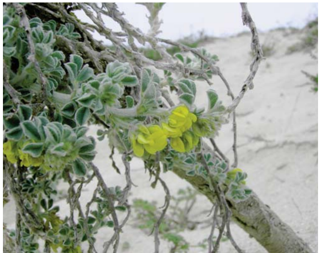
Figura 6.- Medicago marina L. en la playa de Mar de Fóra

Citada por Lago Canzobre et al. , (1989a) en la zona.