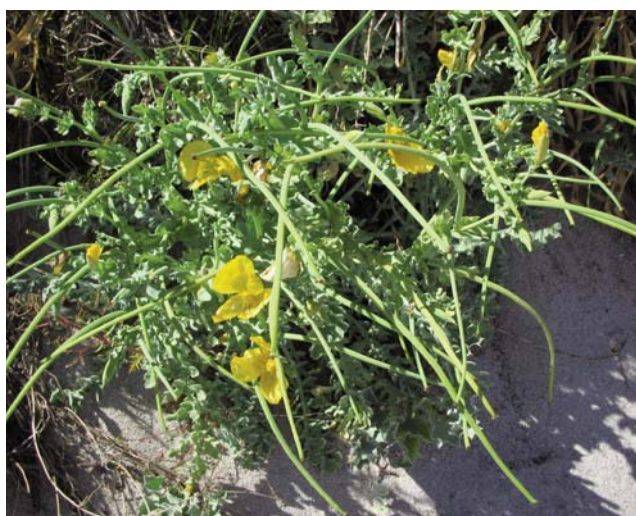
Figura 2.- Glaucium flavum Crantz en la playa de Mar de Fóra

A Coruña, Fisterra: Playa de Mar de Fóra, 29TMH7750, 1 m, en la primera línea de vegetación de la playa.