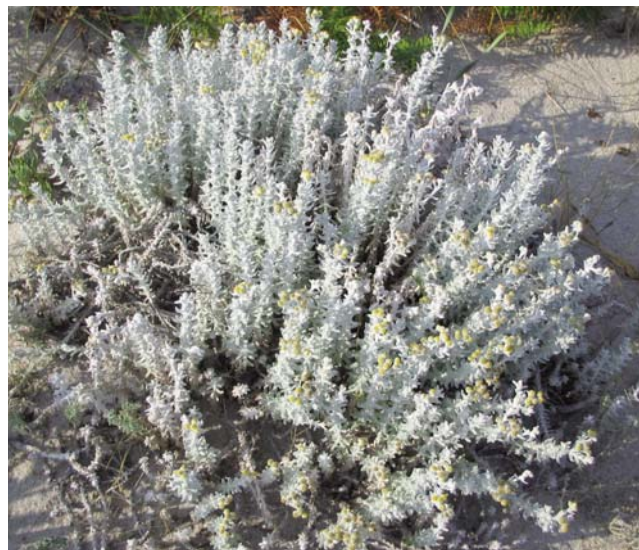
Figura 9. - Otanthus maritimus (L.) Hoffmanns. & Link en la playa de Mar de Fóra

A Coruña, Fisterra: Playa de Mar de Fóra, 29TMH7750, 3 m, sobre dunas secundarias.