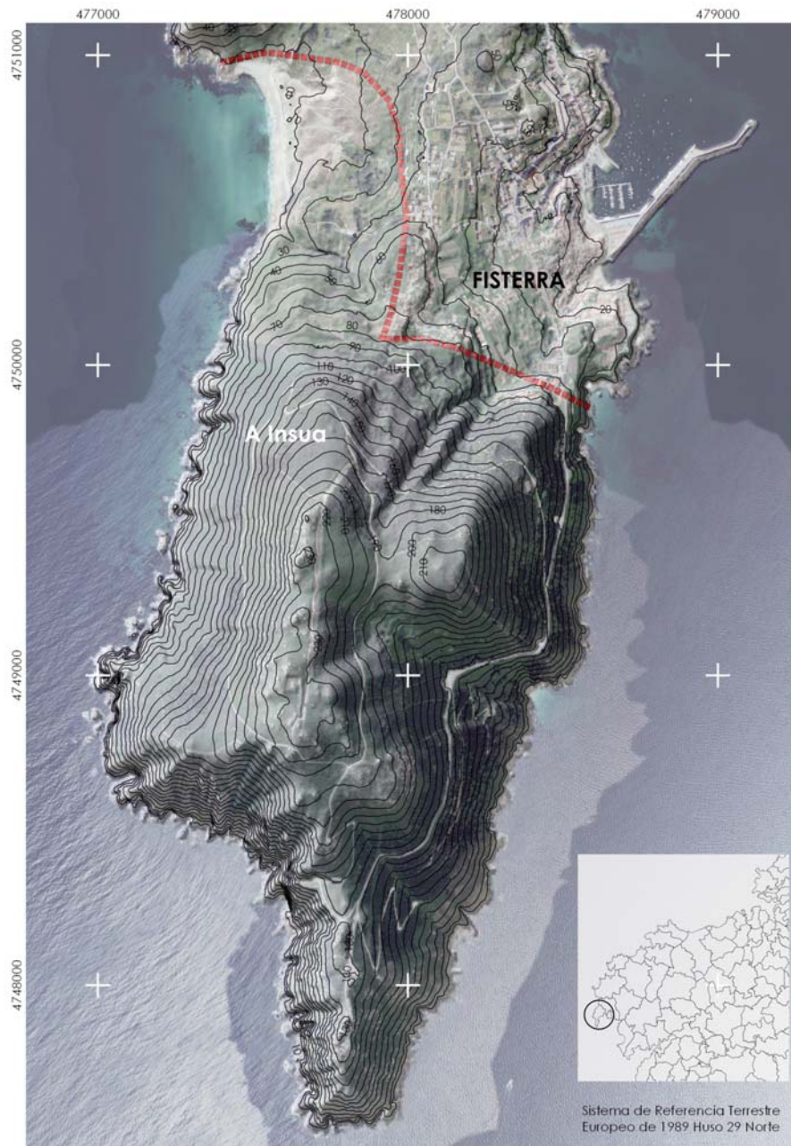
Figura 1.- Plano de localización

Existen dos trabajos previos sobre la flora de este enclave, Lago Canzobre et al. (1989a y b) en los que los autores realizan un estudio específico sobre la flora y citan 224 taxones. Aunque otros autores hacen referencia a algún taxón presente en Fisterra en diferentes trabajos, las contribuciones botánicas a este espacio han sido hasta el momento escasas.