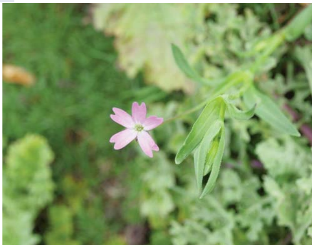
Figura 3.- Silene laeta (Ait.) Godron en la playa de Mar de Fóra