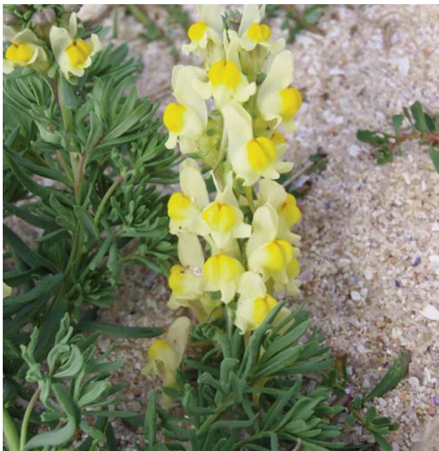
Figura 8. - Linaria polygalifolia Hoffmanns. & Link subsp. polygalifolia en las dunas de Mar de Fóra

A Coruña, Fisterra: Playa de Mar de Fóra, 29TMH7750, 3 m, sobre dunas secundarias.