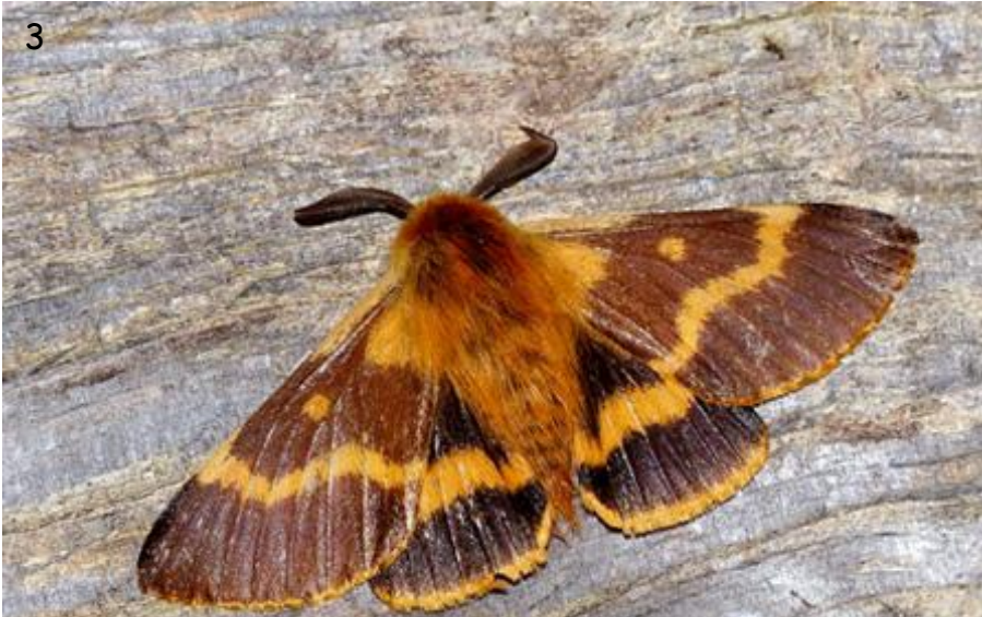
Figs. 3-6.- Lemonia dumi , Sierra de Guadarrama, Segovia.