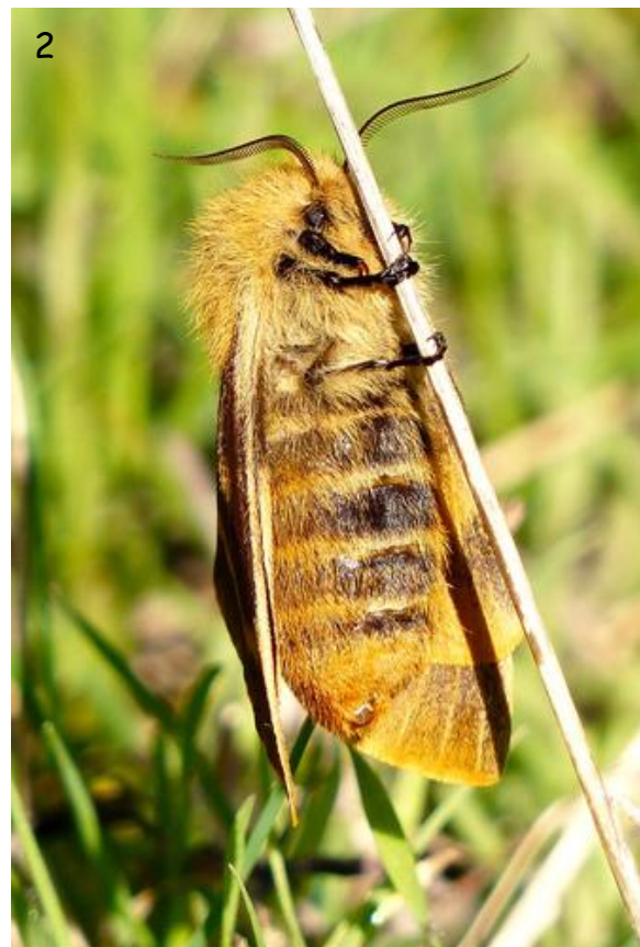
Figs. 1. y 2. - Adulto ♀ de Lemonia dumii , Sierra de Guadarrama, Segovia.