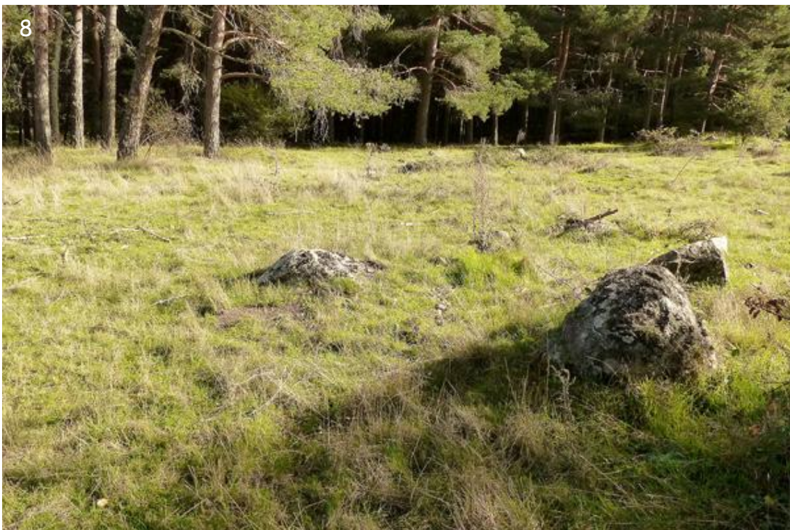
Figs. 7 y 8. - Hábitat de Lemonia dumi en Segovia. 7. - Zona oriental de Guadarrama. 8. - Zona occidental de Guadarrama.