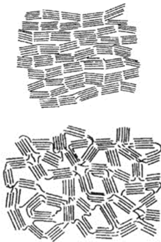
Carbones grafitizables y no grafitizables, según esquema de Rosalind Franklin

La siguiente figura muestra el esquema clásico de Rosalind Franklin sobre la estructura de carbones grafitizables y no grafitizables que seguro que os resulta familiar.