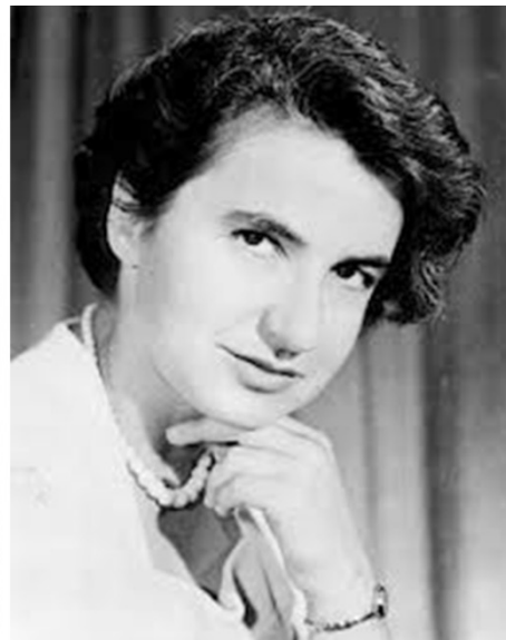
Marie Stopes (izquierda) y Rosalind Franklin (derecha)