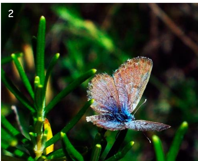
Fig. 2.- Pseudophilotes panoptes : Sierra de Hornachuelos, Hornachuelos, Córdoba, 370 m.s.n.m., macho deteriorado, 16-V-2013.