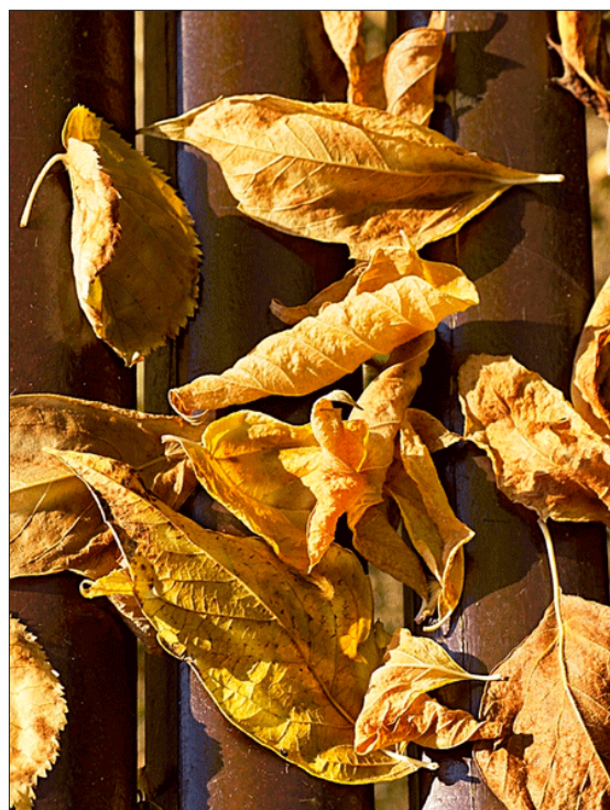
HOJAS EN EL BANCO I FLAVIA FALQUEZ http://500px.com/photo/18648943