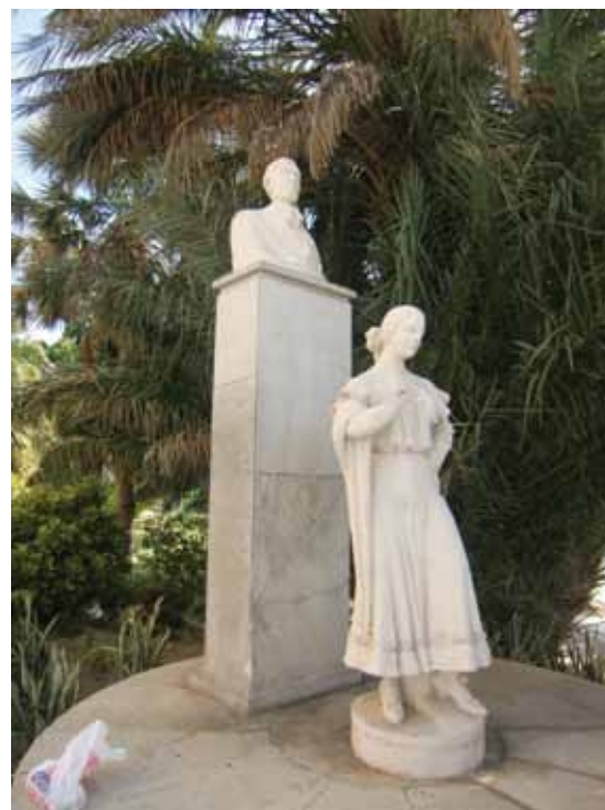
Monumento de Adrián Risueño dedicado a Arturo Reyes, 1964.

costumbrista malagueña: De Estébanez Calderón a Arturo Reyes.