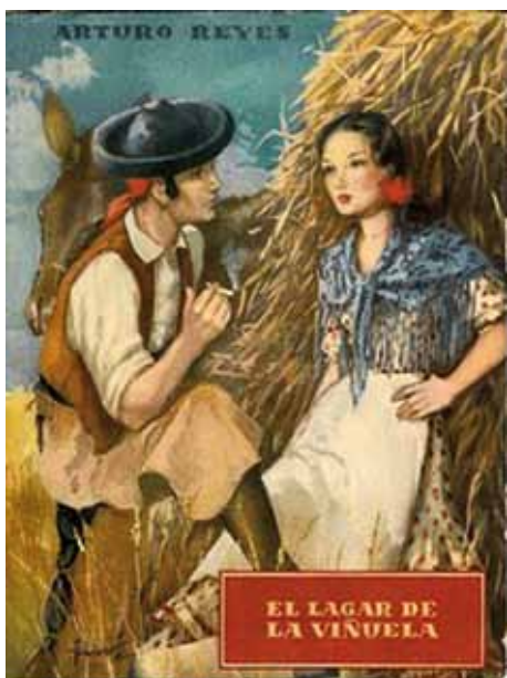
Novela El lagar de la Viñuela , 1897.

de Eugenio Sellés, Jacinto Octavio Picón, José Ortega Munillas, José Ortega y Gasset, Ramiro de Maeztu, Jacinto Benavente, Alejandro Sawa, entre otros. Continuó publicando cuentos andaluces: Del Bulto a la Coracha , De mis parrales y De Andalucía ; novelas: Las de Pinto y Cielo azul .