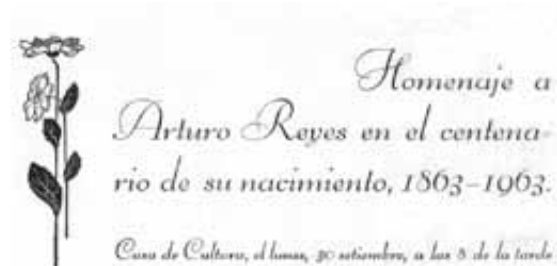
Homenaje en el centenario de su nacimiento en la Casa de la Cultura 1863-1963.