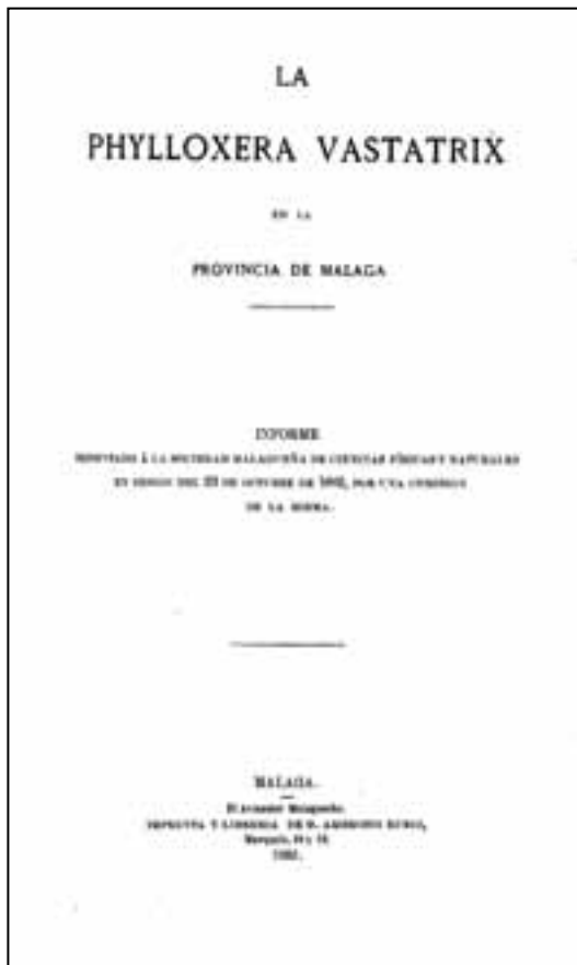
Informe sobre la Phylloxera . Sociedad Malagueña de Ciencias.