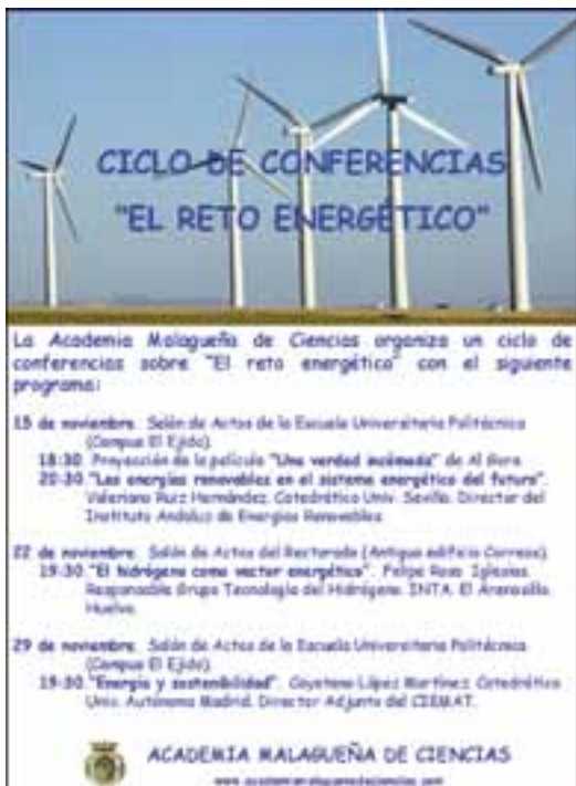
Cartel anunciador del ciclo de conferencias sobre El Reto Energético.

LA NANOTECNOLOGÍA AL SERVICIO DE LA MEDICINA. 2009. Vol. 11: 15-25.