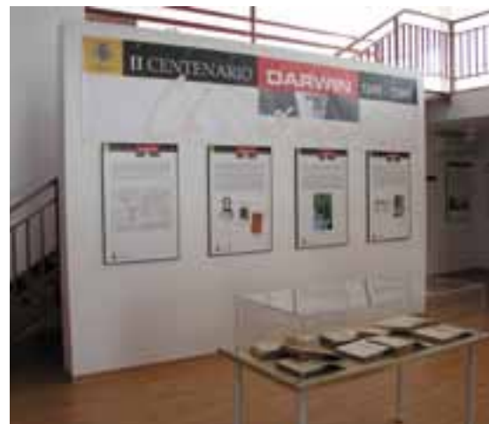
Exposición sobre el centenario de Darwin

Flores Moya A. 2009. Los microorganismos fotosintéticos como modelo de evolución experimental. Vol. 11: 37-42.