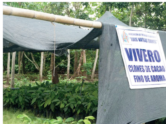
Figura 10. Vivero que oferta clones de cacao fino de aroma. Iniciativa auspiciada por una organización de productores. [Foto SPM].

confirma que esos clones son los menos sembrados y solicitados a los viveristas.