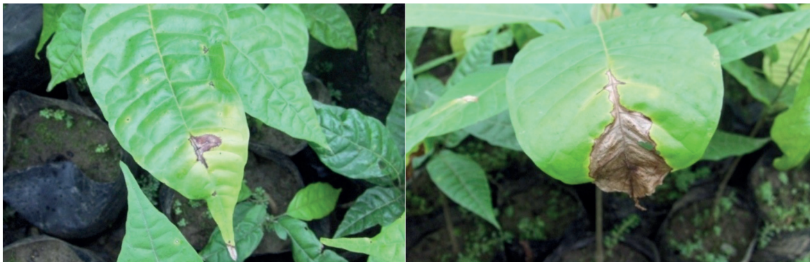
Figura 2. Síntomas iniciales a la izquierda y avanzados de la antracnosis en hojas, nótese la combinación de clorosis y necrosis. [Fotos DP/ CC].

Cuando estas manchas son abundantes, se unen hasta formar parches pardos oscuros que pueden secar la hoja completamente (Fig.2). El síntoma típico son manchas pardas en forma de cuña que avanzan desde el ápice de la hoja hacia el centro de la hoja por la nervadura principal y se conoce como antracnosis. Un aspecto a destacar es el hecho de que las defoliaciones repetidas pueden a veces causar la muerte del brote, dando lugar al desarrollo de ramillas laterales que en ocasiones dan la apariencia de una escoba de bruja (Hardy 1961; Akrofi et al. 2016).