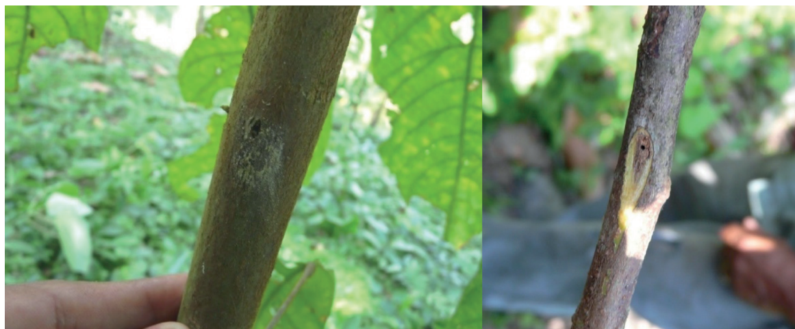
Figura 8. Tallo de una plántula de vivero perforado por la alimentación de Xyleborus spp. mostrando aserrín (izquierda). Plantade másde cuatromeses con perforación, y necrosiscausada secundariamente por L. heobromae (derecha).

El papel de los insectos benéficos es poco importante en vivero, que es la única fase en la que se justifica el control de insectos destructivos (Enríquez 1985). El reducido tamaño de los viveros disminuye el peligro de la utilización de insecticidas con prolongada residualidad para el combate de insectos-plaga, ya que a su vez estos insecticidas también destruyen a los insectos benéficos (polinizadores, parásitos y predadores) (Páliz et al. 1982; Valerazo et al. 2013).