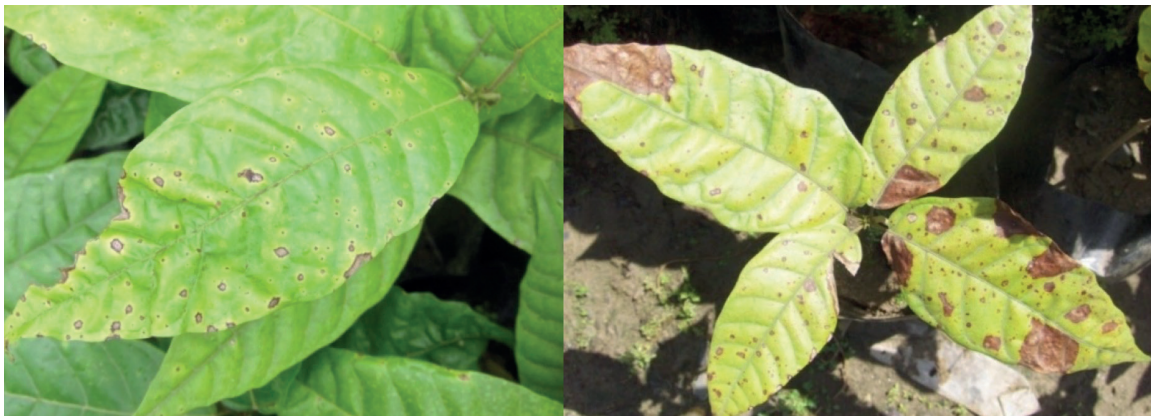
Figura 3. Síntomas iniciales y avanzados causados por C. cassiicola . [Fotos DP/ CC].

En plantaciones adultas se considera su daño como insignificante, tanto en hojas (Urdaneta y Delgado 2007) como en frutos (Falconi et al. 2007).