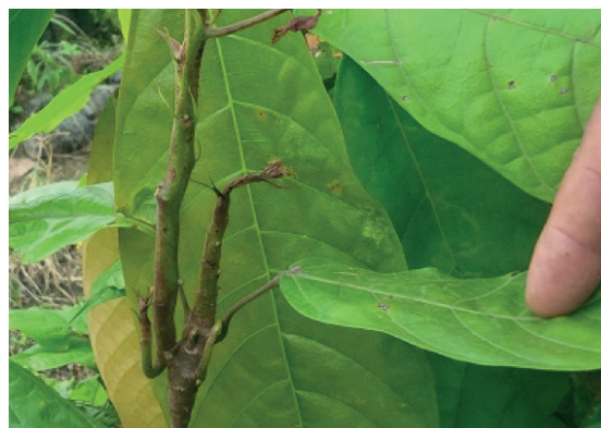
Figura 5. Hipertrofiado de los tejidos del cogollo en una plántula de cacao afectada por M. perniciosa en vivero.

Síntomas en viveros. Este hongo produce enplántulas de vivero atrofiado sobre crecimiento, que se manifiesta con un engrosamiento de la yema terminal (Fig. 5) o de las laterales (Maddison y Mogrovejo 1985). En la primera etapa de la infección el hongo establece una relación biotrófica con el hospedante, siendo esta etapa donde causa la hipertrofia, la pérdida de la dominancia apical y la proliferación de las yemas axilares de los tejidos jóvenes de cacao (End et al. 2014). La hipertrofia de los meristemos infecta y siempre causa muerte total de los tejidos afectados. Hasta un 21% de un total de 600 plántulas de vivero de 5-7 meses de edad manifestaron síntomas de escoba de bruja a los dos meses de su trasplante a campo, lo que sugiere que fueron infectadas en el vivero (Maddison y Mogrovejo 1985). Se ha demostrado que este hongo se transmite por semilla (Cronshaw y Evans 1978; End et al. 2014). Para la obtención de semillas para la siembra del patrón se recomienda descartar los frutos de plantas afectadas por esta enfermedad.