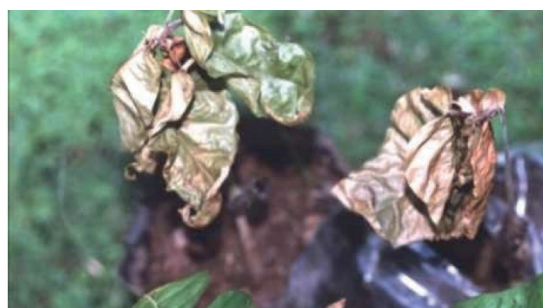
Figura 1. Tizón en las hojas, marchitamiento y muerte de plantas causado por P. palmivora . [Foto Dercy Parra (DP)/ Carmen Camejo (CC)].

Síntomas en vivero. Ocasiona manchas acuosas pardas e irregulares que se presentan en cualquier parte del limbo foliar (Fig.1). En fases avanzadas de vivero provoca una muerte regresiva de las plántulas en viveros (Phillips-Mora y Cerda 2009). Comienza con el oscurecimiento del tejido seguido de una necrosis, síntomas similares tanto en los chupones como en las plántulas (Surujdeo-Maharaj et al. 2016). En general, las hojas jóvenes son más susceptibles que el tejido maduro (Surujdeo-Maharaj et al. , 2016). P. palmivora puede provocar marchitamiento y muerte de las hojas en plantas adultas (Hardy 1961).