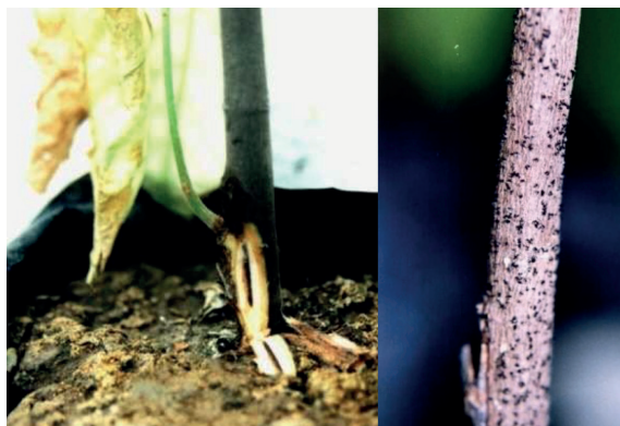
Figura 4. Injerto de cacao infectado por L. theobromae mostrando necrosis en la unión injerto/patrón y picnidios del hongo sobre el tallo del patrón de cacao. [Fotos DP/ CC].

Pudrición seca de los haces vasculares, deshilachado de la corteza del tallo, marchitamiento del injerto, hojas con coloración amarilla intensa y crujiente al tacto (Hardy, 1961). Internamente, los tejidos afectados presentan coloraciones de gris oscuro a pardo rojizo. Aparecen áreas necrosadas en los talluelos, los cuales evolucionan hacia muertes regresivas (Reyes y Capriles 2000). En fases avanzadas se aprecian numerosos picnidios del hongo de color gris oscuro ubicados en el portainjerto o el patrón (Fig.4).