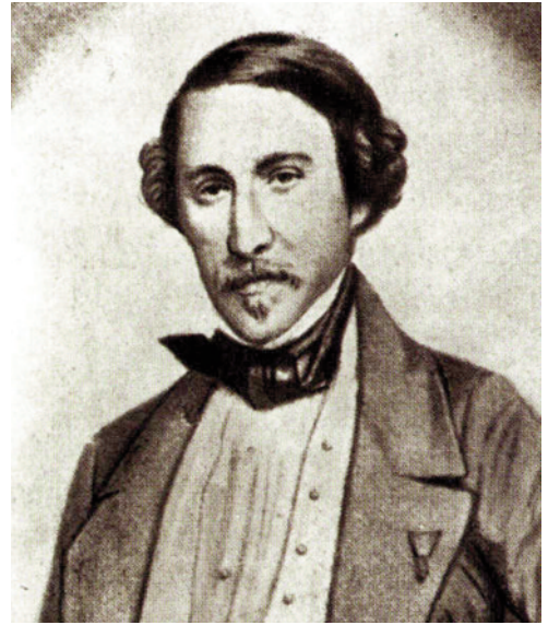
Lám. 2. Sebastián Iradier y Salaverri. Litografía. Anónima. Ca 1849. Dominio público.

Segundo unha biografía escrita por Pío Baroja os seus devaneos amorosos, provocaron a súa fuxida de Salvatierra, pois un marido entrado en anos, a cuxa muller, coqueta e moza, facía a corte, preparaba o seu prendemento e envió ao batallón realista de Álava, “para meterlo en cintura o pegarle cuatro tiros” 1 .