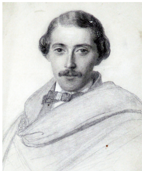
Lám. 4. Retrato de cabaleiro descoñecido. Dionisio Fierros. Lápis sobre papel. 17,7x11,9 cm. Museo de Belas Artes, A Coruña.

O debuxo da lámina 4, Retrato de cabaleiro descoñecido , foi posiblemente feito uns anos antes, (porque representa a un personaxe visiblemente máis novo), quizais entre 1845 e 1850, momento no que Dionisio Fierros era aínda alumno da Escola de Belas Artes, e do taller dos Madrazo, pola súa relación con estes últimos podemos supoñer que estaba en contacto cos ambientes artísticos e culturais de Madrid. Os teatros, os espectáculos musicáis e circenses da época, eran frecuentados por todas as clases sociais, preferentemente polos artistas e aristócratas, que admiraban e seguían aos actores e a os músicos, con auténtica devoción.