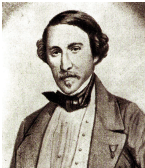
Lám. 3. Sebastián Iradier y Salaverri. Litografía. Anónima. Ca 1849.